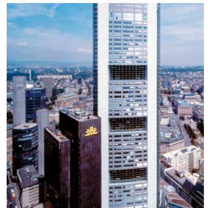
Commerzbank Zentrale in Frankfurt