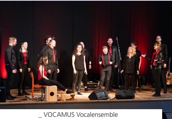
_ VOCAMUS Vocalensemble