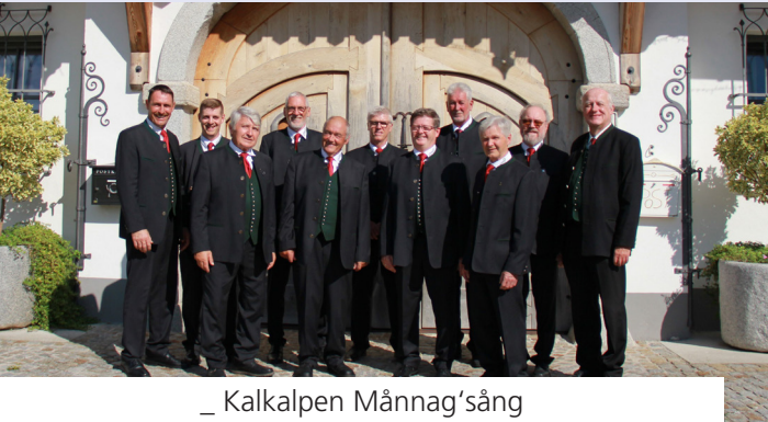
_ Kalkalpen Männag'sång