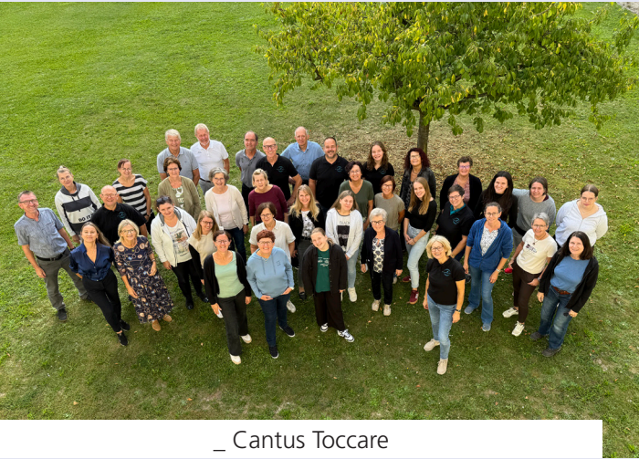
_ Cantus Toccare