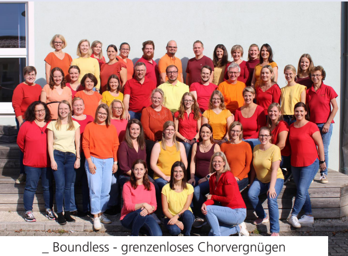
_ Boundless - grenzenloses Chorvergnügen