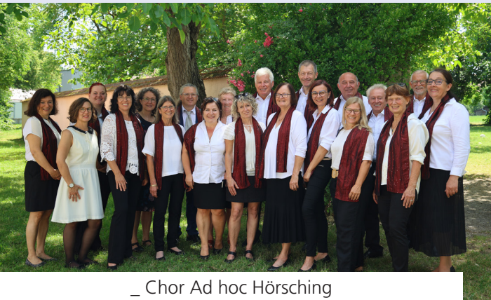
_ Chor Ad hoc Hörsching