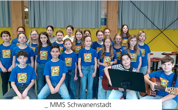
_ MMS Schwanenstadt