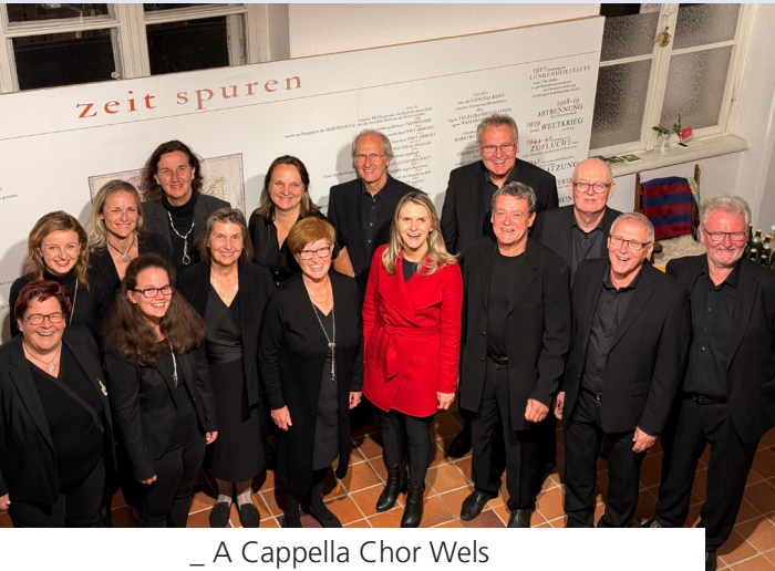
_ A Cappella Chor Wels