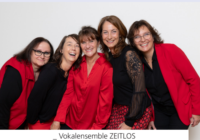
_ Vokalensemble ZEITLOS