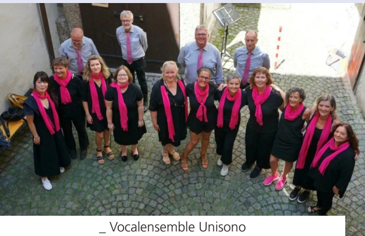
_ Vocalensemble Unisono