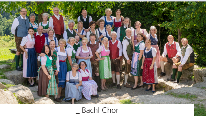
_ Bachl Chor