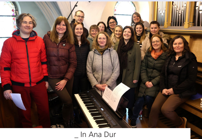
_ In Ana Dur