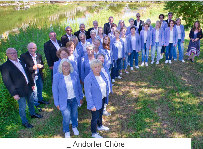
_ Andorfer Chöre