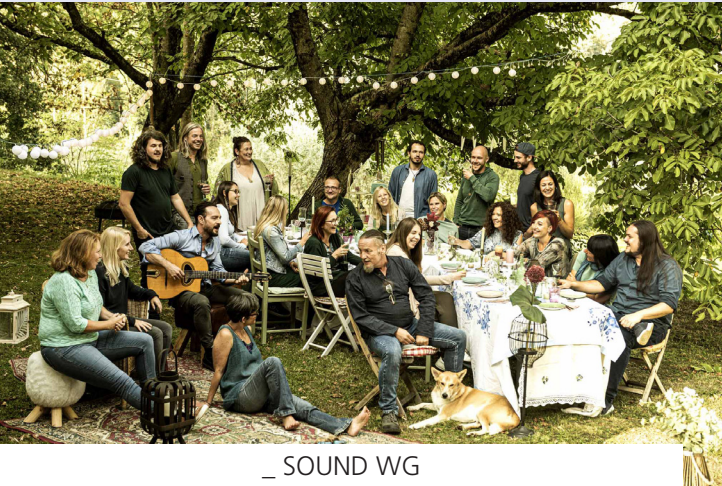
_ SOUND WG