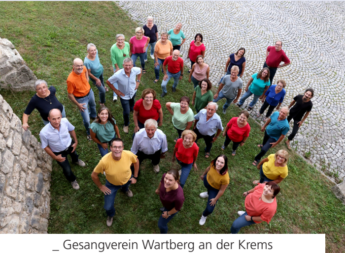
_ Gesangverein Wartberg an der Kreams