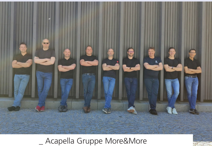
_ Acapella Gruppe More&More