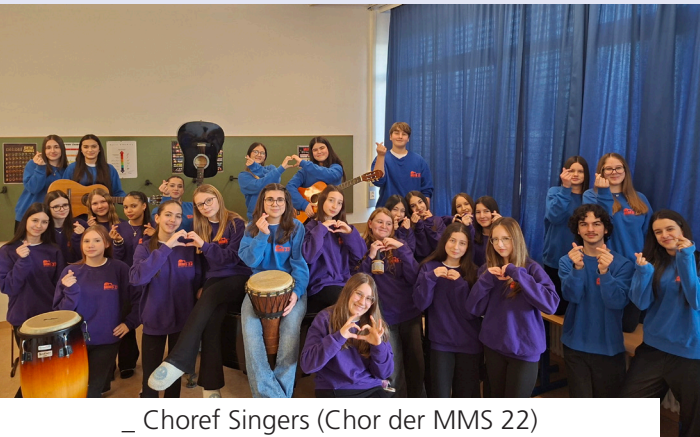
_ Choref Singers (Chor der MMS 22)