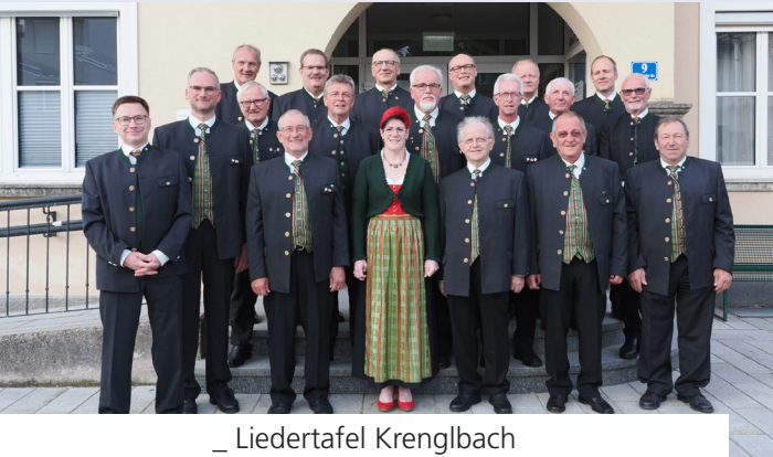
_ Liedertafel Krenglbach