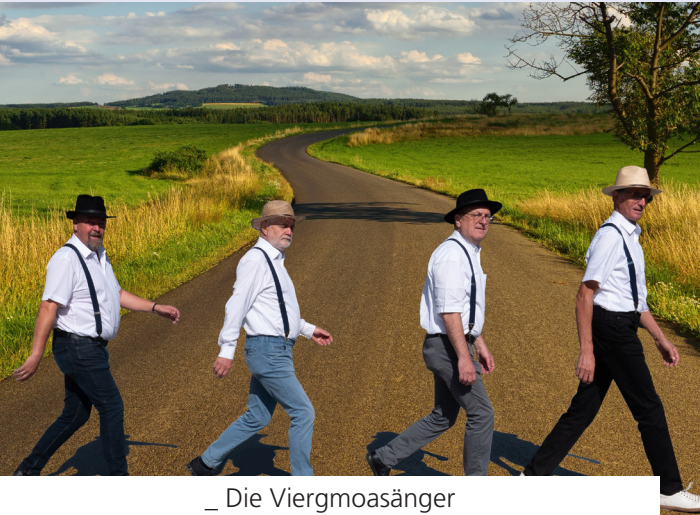
_ Die Viergmoasänger