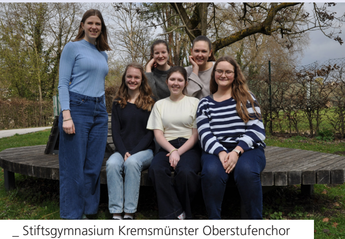
_ Stiftsgymnasium Kremsmünster Oberstufenchor

Die Schülerinnen und Schüler meistern gemeinsam seit Schulbeginn das Chorsingen. Mit viel Freude und Begeisterung konnten wir schon einige Male auftreten. (Karikaturausstellungseröffnung, Adventkonzert, musikalischer Elternabend...)