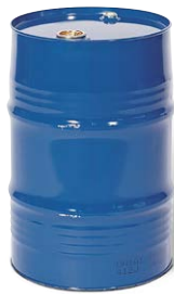
Fût à bonde en acier, 60 litres, intérieur brut N° de commande: 122-851-M2