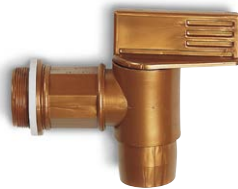
Robinet FH 2 en polyéthylène (PE), filetage Ø 2" N° de commande: 117-105-M2