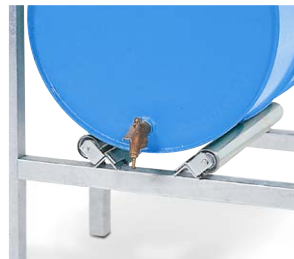
Support rouleau pour le stockage de fûts couchés N° de commande: 114-542-M2