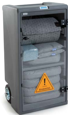
Kit d'absorbants mobile Small en Densorb Caddy, version Universel N° de commande: 267-168-M2