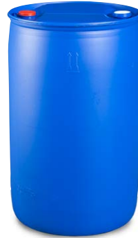
Fût à bonde en plastique, bouchon à vis 3/4" et 2", 220 litres N° de commande: 266-141-M2