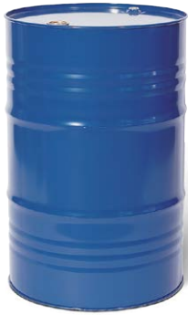
Fût à bonde en acier, 216,5 litres, intérieur brut N° de commande: 117-976-M2