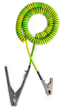
Câble de terre spiralé avec 2 pinces en inox, longueur de 3 m, ATEX N° de commande: 244-028-M2