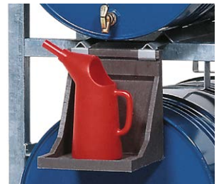
Support de récipient, en polyéthylène (PE), Dimensions l x p x h : 270 x 270 x 300 mm N° de commande: 114-902-M2