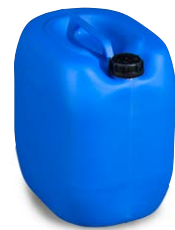
Bidon en polyéthylène (PE), 30 litres, bleu N° de commande: 266-997-M2