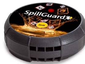
Système de détection de fuites SpillGuard® ATEX pour zone 0 N° de commande: 271-433-M2