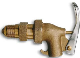
Robinet de soutirage en laiton 3/4", auto fermant N° de commande: 117-132-M2