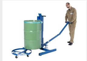
Einfaches Beschicken von Fassrollern, Paletten und Bodenheizplatten