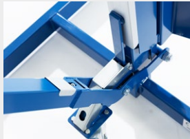
Mit Sicherheitsschloss zur Arretierung auf der höchsten Position