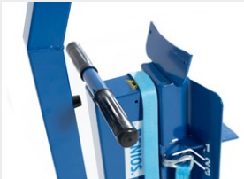
Praktische Griffe zum Verfahren des Fasshebers