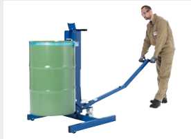
Großer Hebelarm für einfaches Heben der Fässer