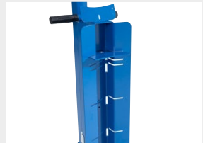
Für verschiedene Fassgrößen