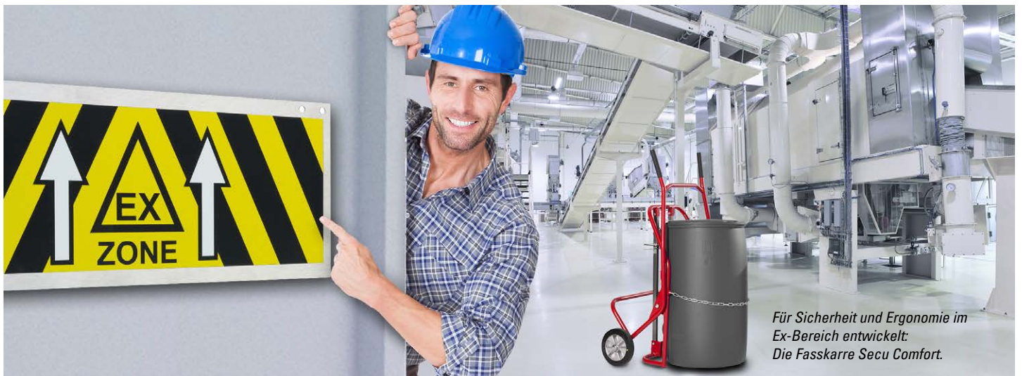
Für Sicherheit und Ergonomie im Ex-Bereich entwickelt: Die Fasskarre Secu Comfort.

Das Thema ATEX in der Gefahrstofflagertechnik ist bei systematischer und strukturierter Betrachtung und unter Einhaltung der entsprechenden Vorschriften und Richtlinien durchaus anwenderfreundlich zu bewältigen.