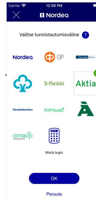
Aktivointi toisen pankin tunnuksilla