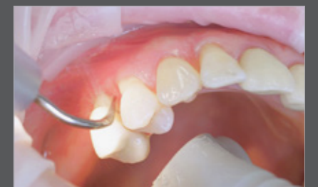
Abb. 3 Proxeo Luftscaler mit 1AP Wird eine marginale Parodontitis diagnostiziert, erfolgt das initiale Debridement sehr effizient mit einem Luftscaler.