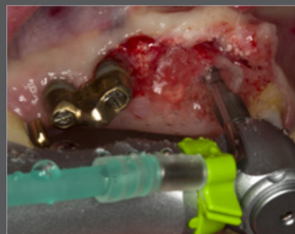
Abb. 4 Implantmed und WS-56

Alternativ lässt sich das Implantatlager mit piezochirurgischen Systemen präparieren, für die spezielle Instrumentensätze zur Verfügung stehen (18). Mit anderen Spezialinstrumenten kann schonend und zugleich sehr effektiv Knochen bearbeitet werden. Indikationen sind zum Beispiel Kieferkammsspaltung, chirurgische Zahnentfernung und die Präparation von Knochenblöcken oder lateralen Fenstern für Augmentationen (19). Hoch entwickelte piezochirurgische Geräte sind zugleich minimalinvasiv gegenüber Weichgewebe.