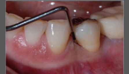
Abb. 1 WHO Sonde Ein regelmäßiges parodontales Screening gehört zur Basisdiagnostik, besonders wenn eine Implantation geplant ist.