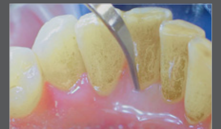
Abb. 2 Tigon+ mit 3U Zahnsteinentfernung mit Ultraschall ist wesentlicher Teil der professionellen Zahnreinigung.