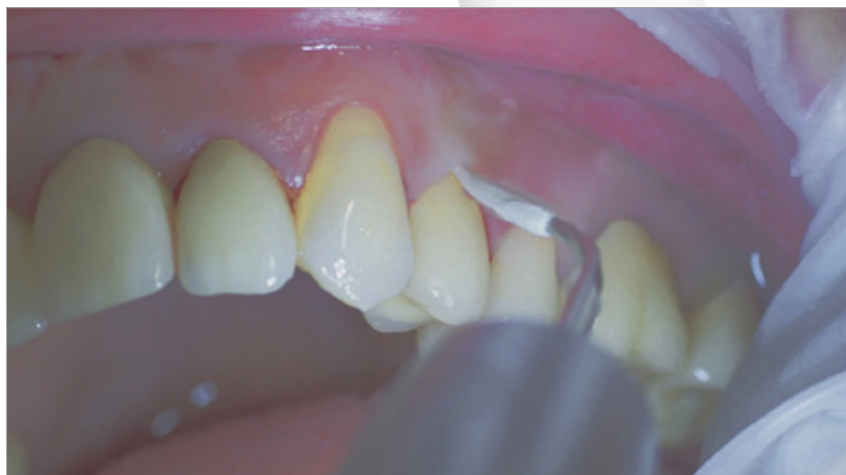
Abb. 7 Tigon + mit 1l

So sinkt das Risiko für eine Periimplantitis schon bei einer jährlichen sorgfältig durchgeführten Recallsitzung von 43,9 Prozent (kein Recall) auf 18 Prozent, also um mehr als die Hälfte (28). Für diesen Zweck sind Ultraschallsysteme mit speziellen materialschonenden Instrumenten geeignet, zum Beispiel aus PEEK (Abb. 7) oder entsprechende Handinstrumente (29).