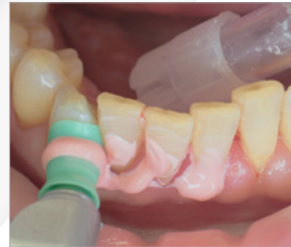
Abb. 6 Proxeo mit Polierkelch

Implantate und Suprastrukturen werden routinemäßig zum Beispiel mit Ultraschallgeräten und speziellen Kunststoffinstrumenten gereinigt.