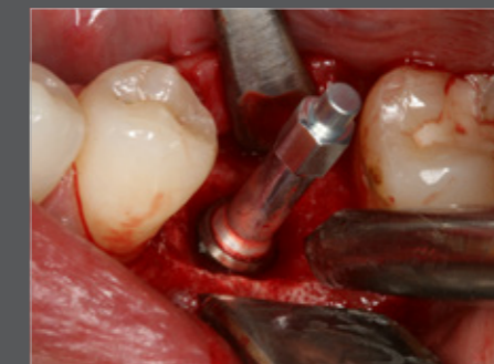
Abb. 5 Ostell ISQ Modul

Ein am ISQ-Wert orientiertes Belastungsprotokoll verbessert die Prognose der Versorgung. Alleiniges Messen des Eindrehwiderstands bringt dagegen keine vergleichbare klinische Sicherheit (21). Werden nach Einbringen des Implantats reduzierte ISQ-Werte gemessen, wird in der Regel ein zweiphasiges Protokoll gewählt. Nach der Freilegung lässt sich dann mit einer erneuten Messung ermitteln, ob die Osseointegration erfolgreich war (Sekundärstabilität) und zu diesem Zeitpunkt bereits eine Belastung voraussagbar möglich ist (22).