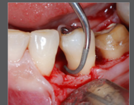
Abb. 9 Piezomed mit P2RD/LD

Parodontale Defekte lassen sich ebenfalls effizient mit einem piezochirurgischen System chirurgisch therapieren.