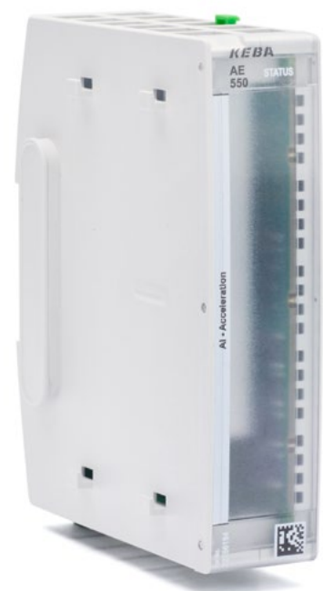
KeControl AE 550

Das AE550 ist damit die Antwort auf die wachsende Nachfrage nach integrierter industrieller KI, die Vision-basierte Inspektionen, datengetriebene Prozessoptimierung und intelligente Steuerungsaufgaben effizient auf einer einzigen Plattform vereint. Darüber hinaus unterstützt KEBA seine Partner bei der digitalen Transformation und der Entwicklung eigener KI-Anwendungen. Die Erfahrung zeigt, dass bei den Industriekunden, die sich derzeit mit dem Einsatz von Künstlicher Intelligenz in der Produktion befassen, in der Regel gut ausgebildete Data Scientists und Programmierer zu finden sind.