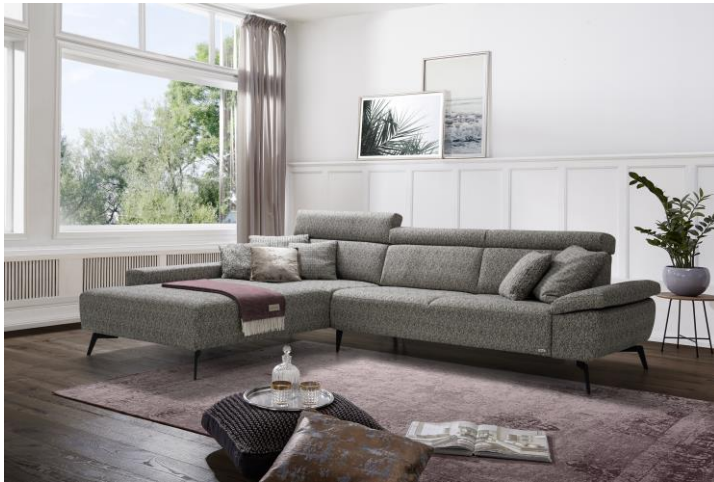
Multifunktionale Sofas erfüllen individuelle Komfortansprüche