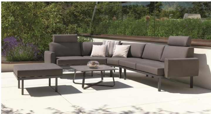
Höchster Komfort auch im Garten

Die Österreichische Möbelindustrie ist eine Berufsgruppe des Fachverbandes der Holzindustrie und somit eine Teilorganisation der Wirtschaftskammer Österreich. Zu ihr zählen 49 Betriebe mit rund 6.000 Mitarbeitern. Die überwiegende Anzahl dieser Unternehmen sind mittelständische Betriebe, die sich in privater Hand befinden. Österreichische Möbelhersteller stehen mit ihren Produkten für hohe Qualität, traditionelles Handwerk, modernste Präzisionstechnik, ökologische Verantwortung und ein Möbeldesign, das durch künstlerische Strömungen im ureigenen Land entstanden ist. www.moebel.at