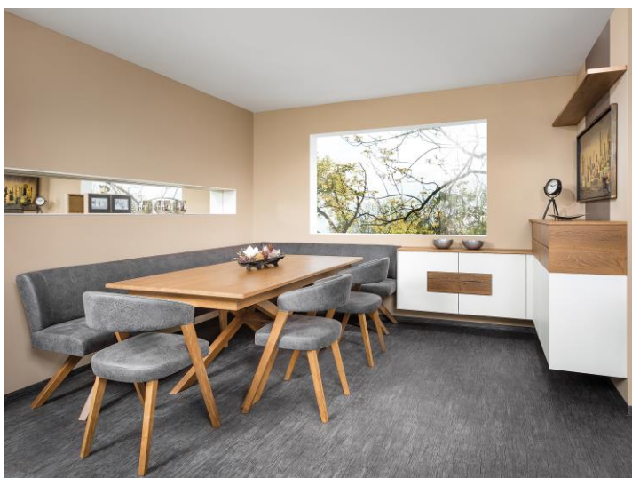
Komfortable Sitzcken zum Essen und Verweilen