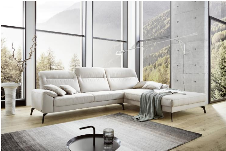
Natürliche Materialien für sinnlichen Genuss