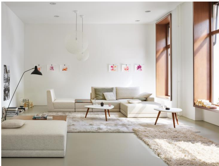
Gemütliche Sitzinseln als Ruhepole