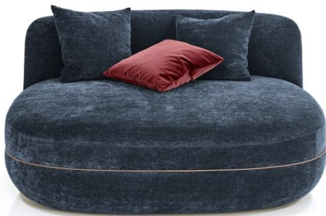
Pouflongue: zum Wohlfühlen gemacht