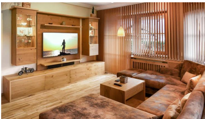
Wohnliches Flair ermöglicht optimale Entspannung