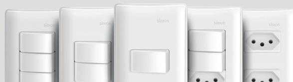
Placa com suporte

ECONOMIA SEM PERDER A QUALIDADE E A ELEGÂNCIA