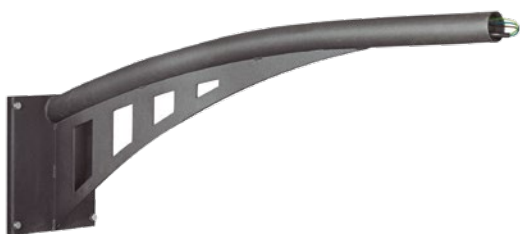
BM1 sans porte-appareillages fixation latérale