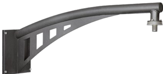
BM1 sans porte-appareillages fixation suspendue