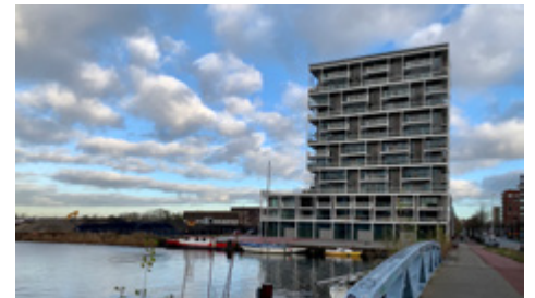
Wohnblock Stories, Olaf Gipser

So entstanden verschiedene experimentelle Projekte, von Selbstbauhäusern über Baugruppenprojekte bis hin zu einer schwimmenden Wohnsiedlung mit Smart Grid.