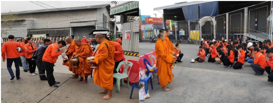
กิจกรรมทำบุญตักบาตรตามประเพณี และทุกวันจันทร์