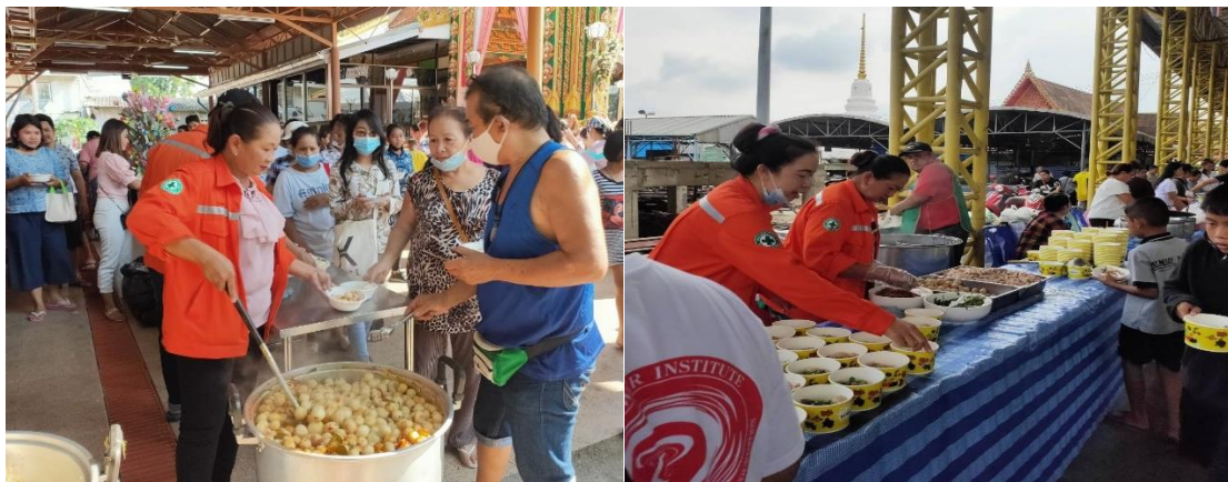
กิจกรรมออกโรงทานในงานเทศกาลสำคัญทางศาสนา