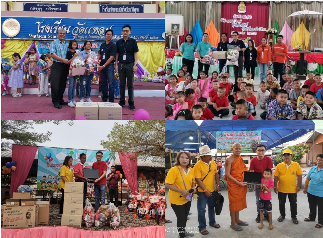
กิจกรรมวันเด็ก

บริษัทฯ เล็งเห็นถึงวันสำคัญของเยาวชน จึงจัดกิจกรรมให้เด็กๆ ในโรงเรียนและแหล่งชุมชนใกล้เคียง เพื่อเป็นการสร้างความสุขให้กับเด็ก สามารถทำกิจกรรมได้อย่างสนุกสนาน และเกิดการเรียนรู้และพัฒนาตนเองอยู่ตลอดเวลาเพื่อเติบโตขึ้นมาเป็นผู้ใหญ่ที่มีคุณภาพ ผ่านการสนับสนุนการจัดกิจกรรมวันเด็ก เป็นต้น