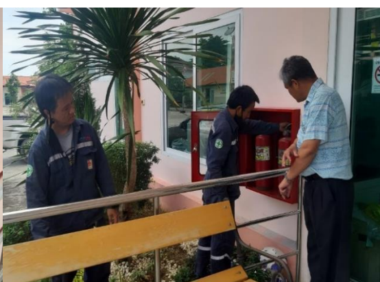
ติดตั้งชุดอุปกรณ์ถังดับเพลิง โรงเรียนวัดแหลม