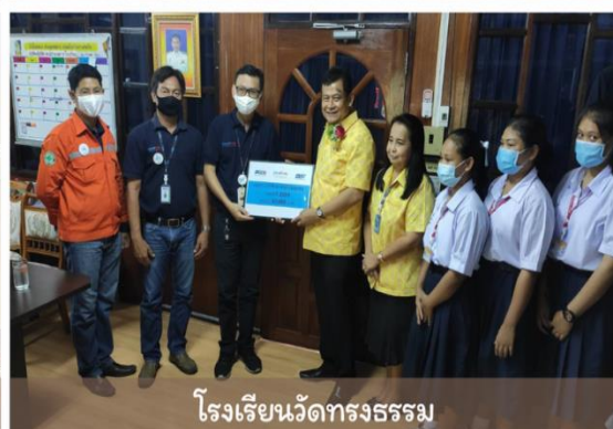
กิจกรรมมอบทุนการศึกษา