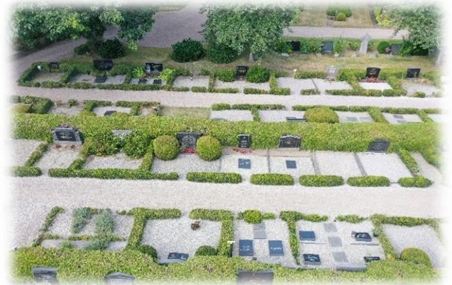
Översiktsbild av begravningsplats.

När stenen är färdig levereras den eller monteras på plats. Montaget sker oftast av stenhuggeriet. För att vara säker på att montaget blir rätt gjort rekommenderas att anlita ett stenhuggeri som är certifierad gravstensmontör. OBS! En stående gravsten som är korrekt monterad skall ha en viss rörlighet för att kunna möjliggöra kontroll samt vid behov demontering. Gravrättsinnehavaren ansvarar för säkerhet och skötsel av sin gravsten. Stående gravstenar kontrolleras normalt ca var 5:e år av Kyrkogårdsförvaltningen så de står säkert. Tidpunkt när en gravsten kan monteras påverkas av gravskick samt kyrkogårdens regler. Vid kistbegravning måste marken sätta sig innan montering är möjlig.