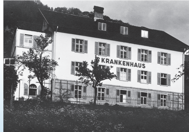
Krankenhaus (vormals Armenhaus, Bürgerheim)