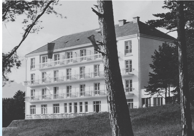
Das Waldhotel (1932-1976)

Vaduz hat in den letzten Jahrzehnten einen enormen Wandel vom einfachen Bauern- und Winzerdorf zum Wirtschafts- und Finanzplatz durchlebt. Liechtensteins Hauptort und dessen Bevölkerung ist ausserordentlich gewachsen. BGV intern hat alteingesessene Mitbürgerinnen und Mitbürger um eine Einschätzung der Entwicklung gebeten.