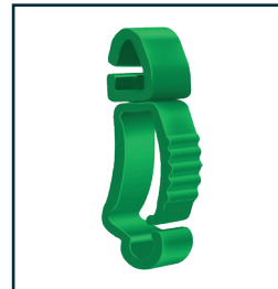
RC-006 Schlauchhalter Ø 6 mm