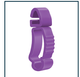
RC-008 Schlauchhalter Ø 8 mm