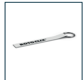
RC-7803 30cm RC-7806 60cm Klettband mit Ring