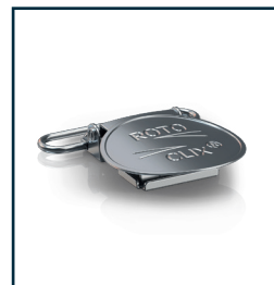
RC-7500 Schlauchhalter Clip