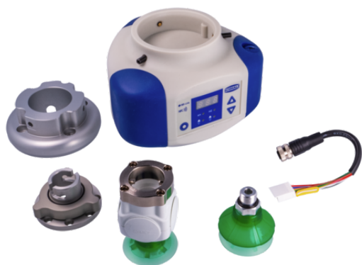
ROB-SET ECBPi YASKAWA