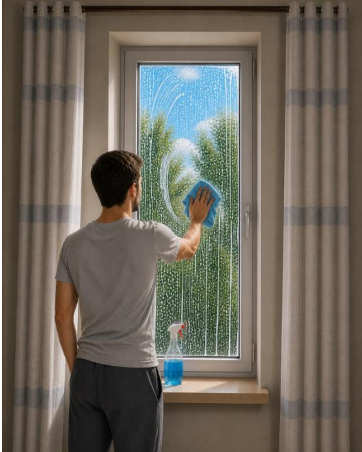
Abbildung 3

Die Fenster sollten immer mit einem weichen Tuch und mildem Seifenwasser gereinigt werden. Dies gilt nicht nur für das Glas, sondern auch für Metallteile, Kunststoff- oder Holzflächen. Aggressive Putzmittel können die Oberfläche beschädigen oder den Korrosionsschutz der Beschläge beeinträchtigen. Verwenden Sie niemals Bürsten oder kratzende Putzschwämme.