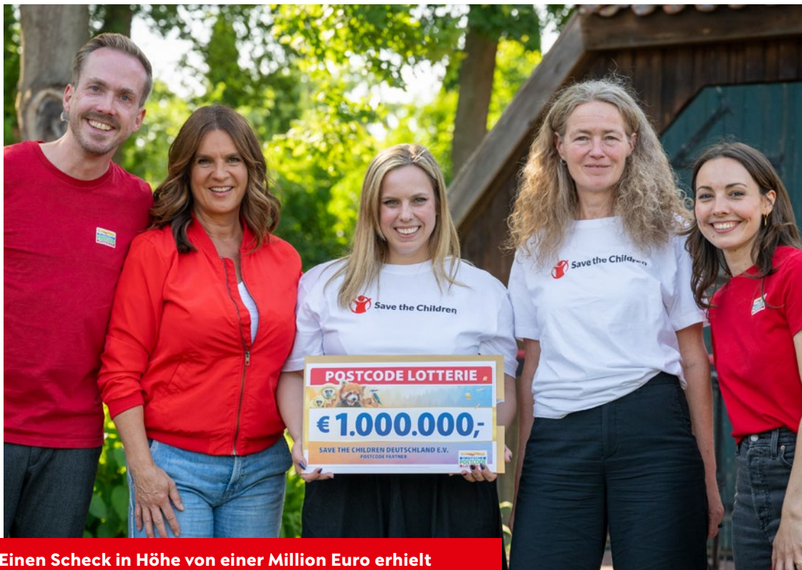
Einen Scheck in Höhe von einer Million Euro erhielt auch die Kinderrechtsorganisation Save the Children e. V.