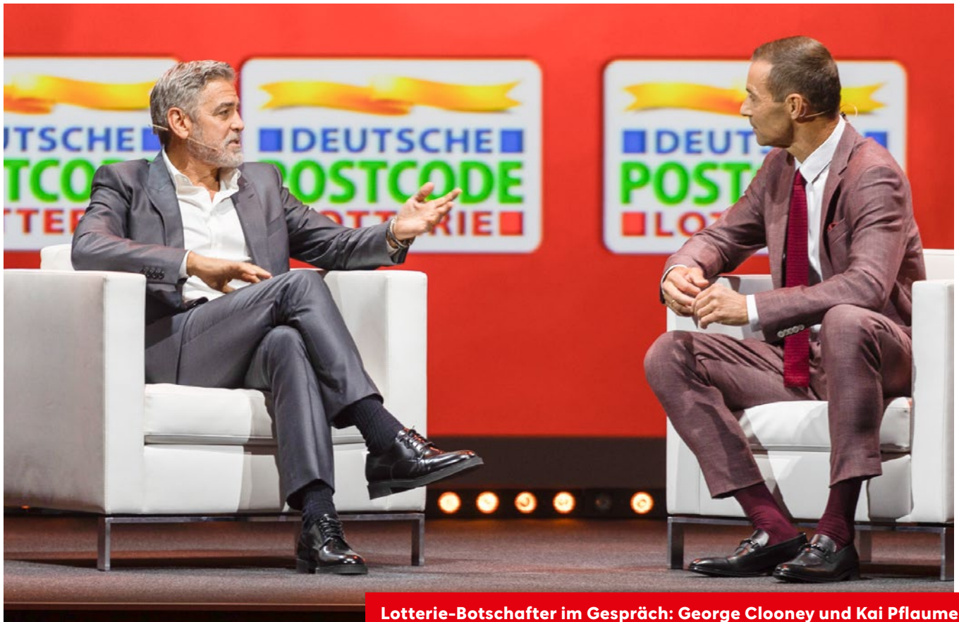
Lotterie-Botschafter im Gespräch: George Clooney und Kai Pflaume.

klasse-Athlet*innen Katarina Witt, Toni Kroos, Roger Federer und Rafael Nadal, die Bildungs- und Gesundheitsaktivistin Sarah Brown und die Menschenrechtsaktivistin Nice Nailantei Leng'ete.