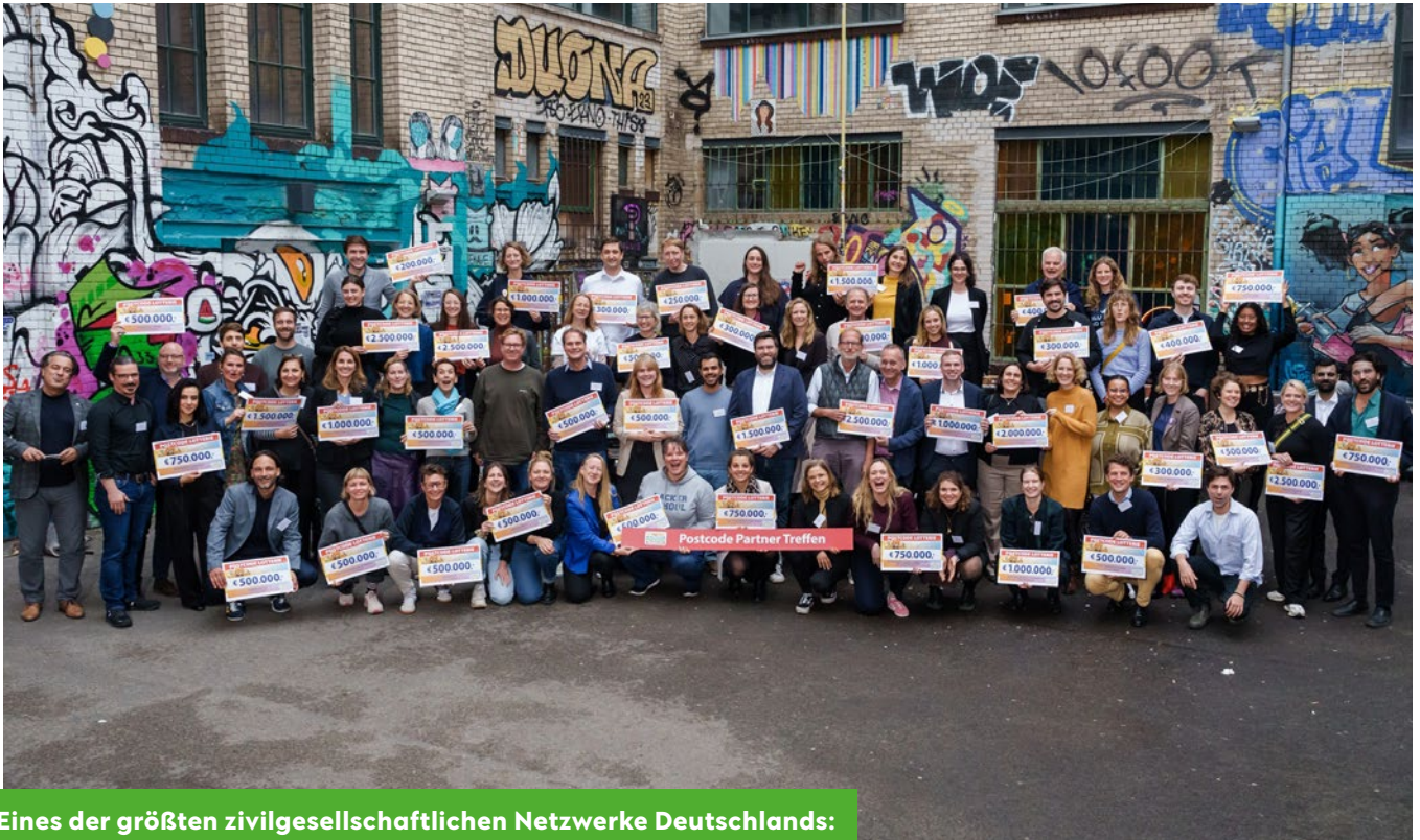
Eines der größten zivilgesellschaftlichen Netzwerke Deutschlands: Gruppenbild mit Postcode Partnern.