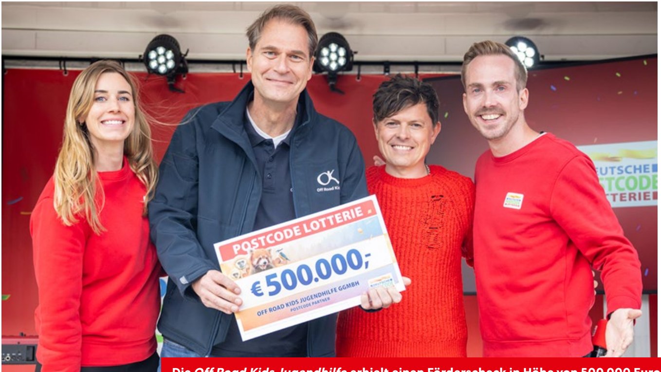
Die Off Road Kids Jugendhilfe erhielt einen Förderscheck in Höhe von 500.000 Euro.