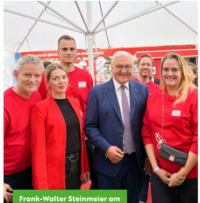
Frank-Walter Steinmeier am Stand der Postcode Lotterie.