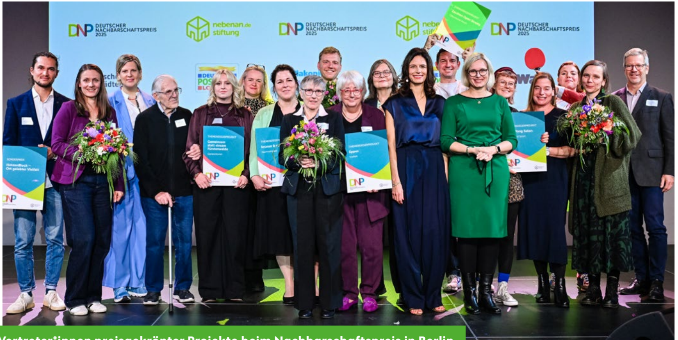
Vertreter*innen preisgekrönter Projekte beim Nachbarschaftspreis in Berlin.