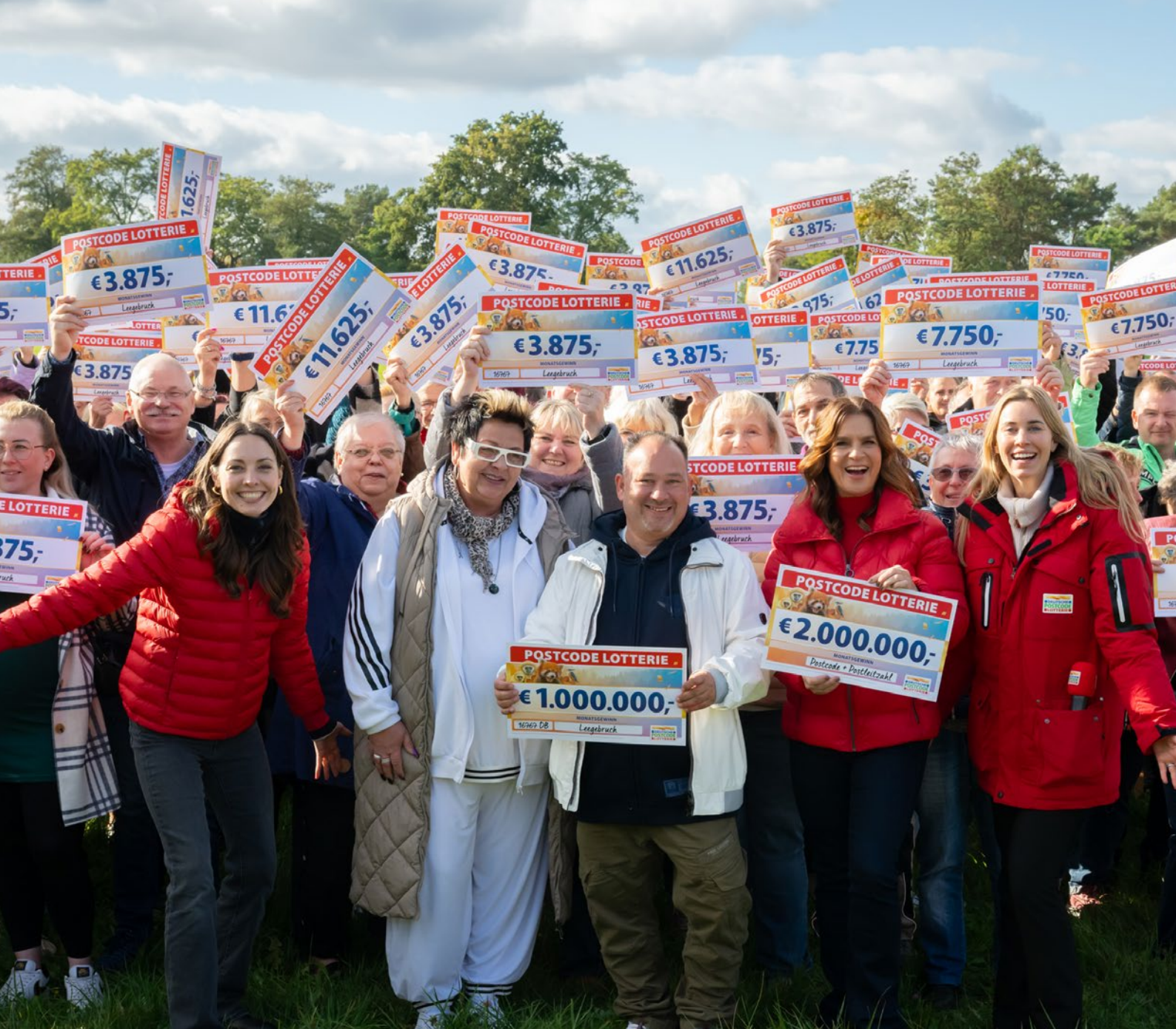
Im brandenburgischen Legebruch freuten sich 190 Gewinner*innen über den Oktober-Monatsgewinn in Höhe von zwei Millionen Euro.