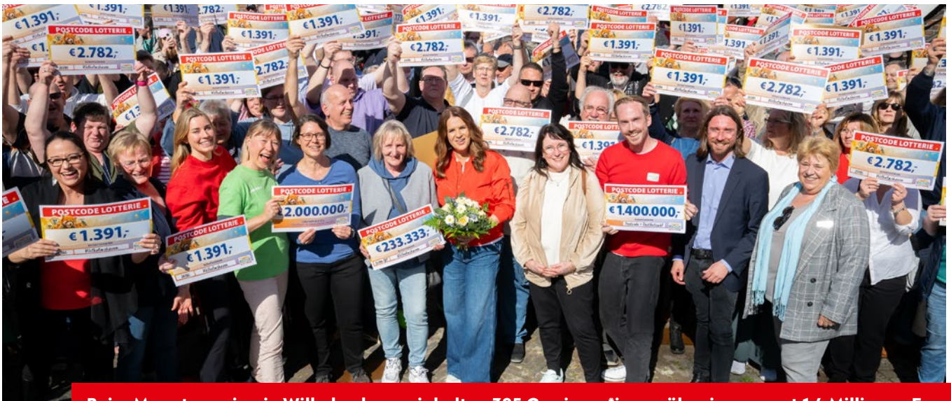
Beim Monatsgewinn in Wilhelmshaven jubelten 385 Gewinner*innen über insgesamt 1,4 Millionen Euro.

Das Gewinnerfest war bombastisch. Vor allem, weil neben ein paar Nachbarn auch einige Bekannte und Verwandte in der Postleitzahl gewonnen haben. Mit meinem Nachbarn, der ebenfalls 233.333 Euro gewonnen hat, habe ich dann noch Sekt getrunken und gefeiert.