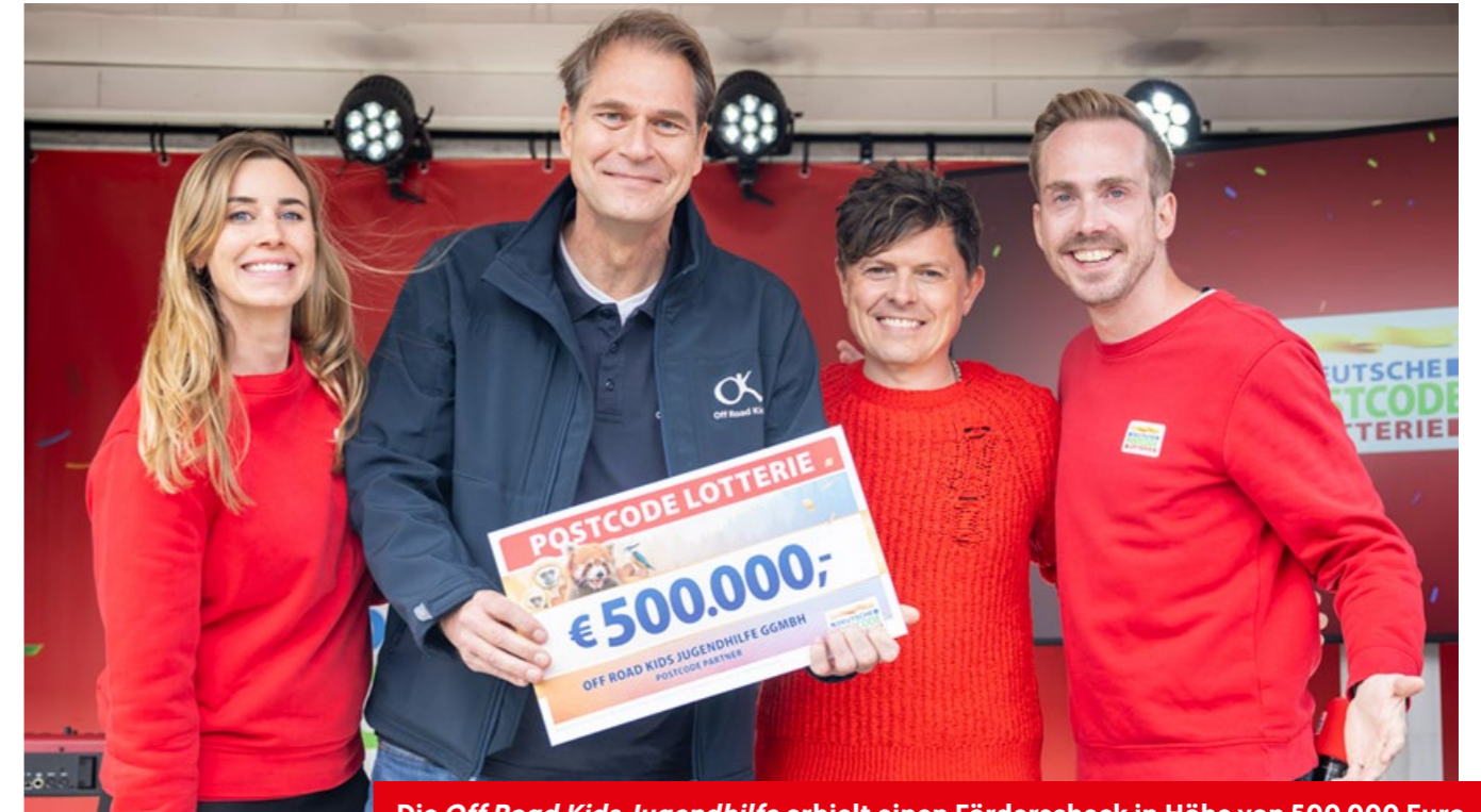
Die Off Road Kids Jugendhilfe erhielt einen Förderscheck in Höhe von 500.000 Euro.