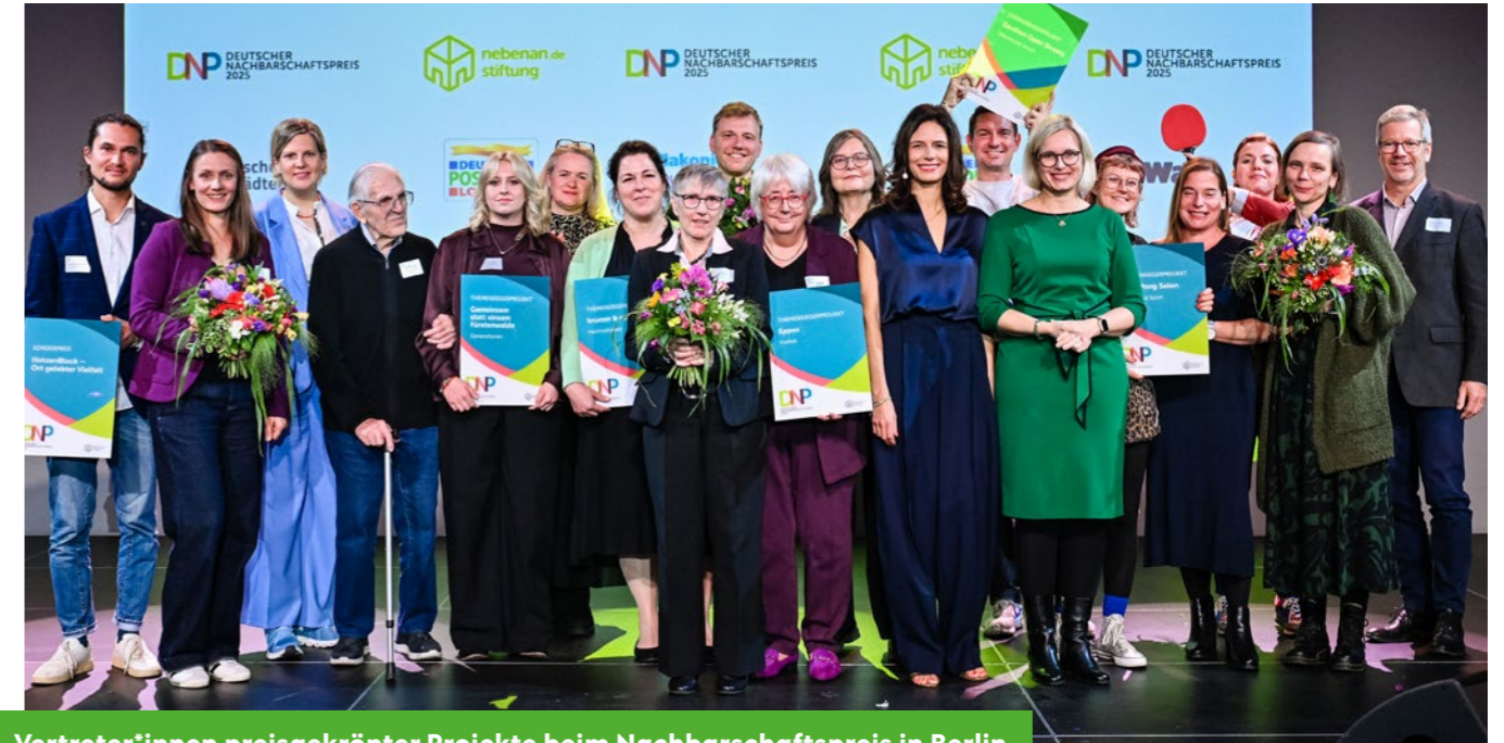
Vertreter*innen preisgekrönter Projekte beim Nachbarschaftspreis in Berlin.

Maffay gemeinsam mit seiner Frau am Stand vorbei, um die vielen kleinen und größeren Kunstwerke zu bestaunen. Mit seinem jährlichen Bürgerfest würdigt der Bundespräsident das ehrenamtliche Engagement in Deutschland und wirbt zugleich für den freiwilligen zivilgesellschaftlichen Einsatz.