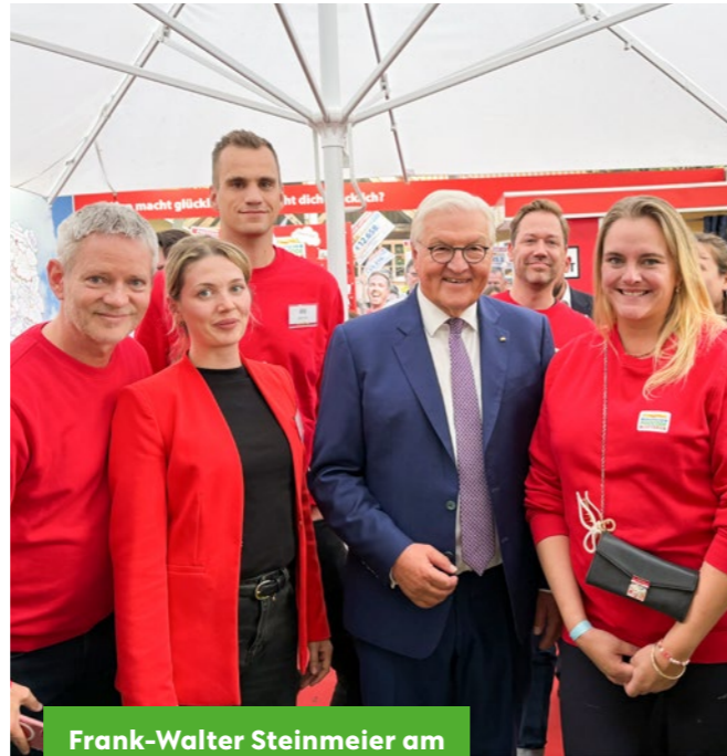
Frank-Walter Steinmeier am Stand der Postcode Lotterie.