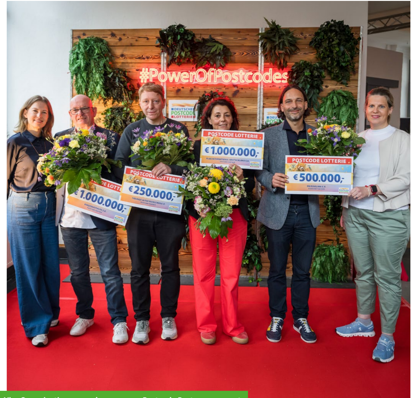
Vier Organisationen wurden zu neuen Postcode Partnern ernannt.

Organisationen durch vertrauensbasierte, langfristige und flexible Förderung. Als einer der größten privaten, unabhängigen Fördermittelgeber in Deutschland hat die Soziallotterie damit eines der größten zivilgesellschaftlichen Netzwerke Deutschlands geschaffen.