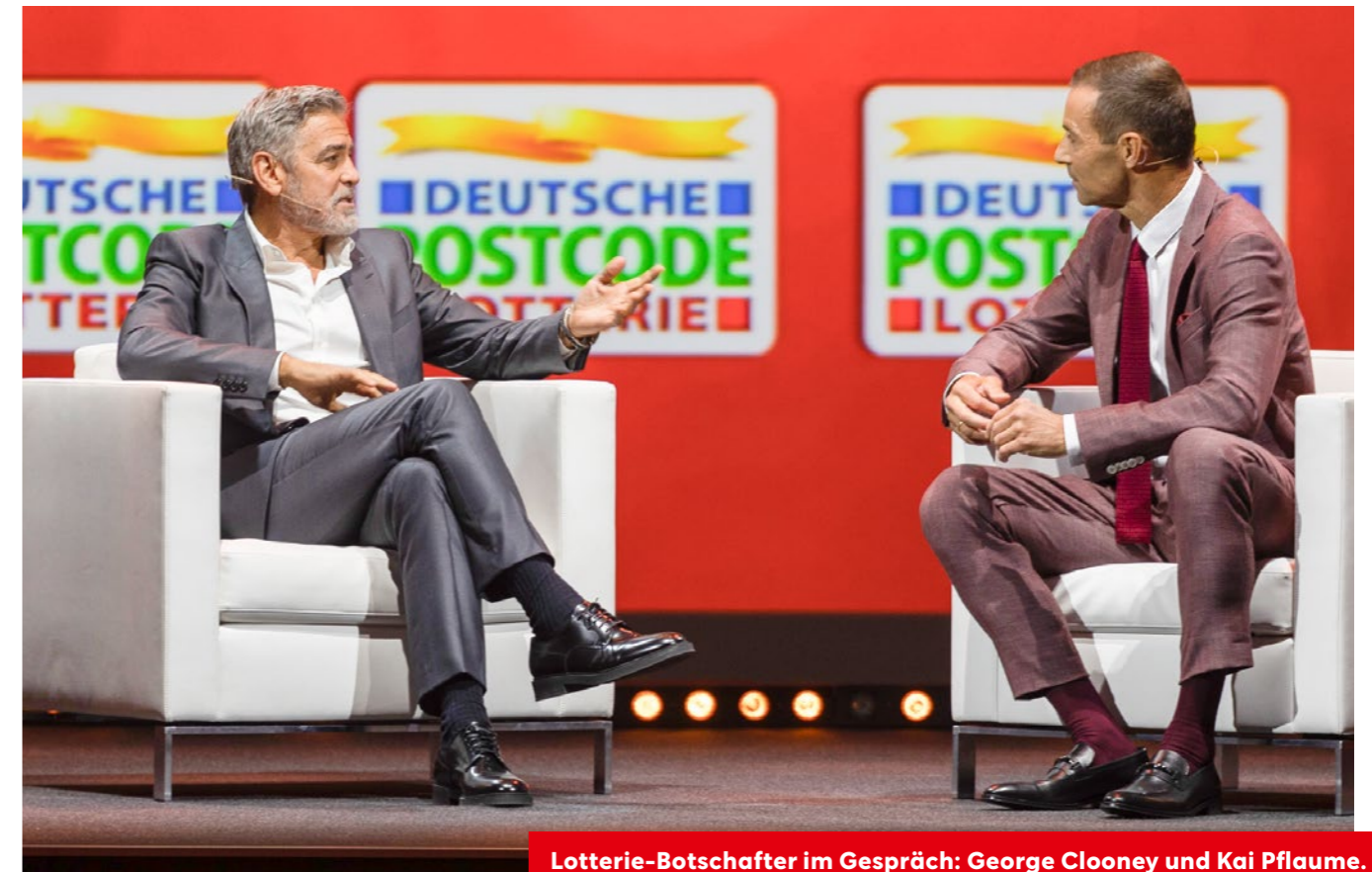
Lotterie-Botschafter im Gespräch: George Clooney und Kai Pflaume.