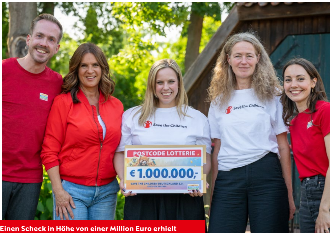
Einen Scheck in Höhe von einer Million Euro erhielt auch die Kinderrechtsorganisation Save the Children e. V.