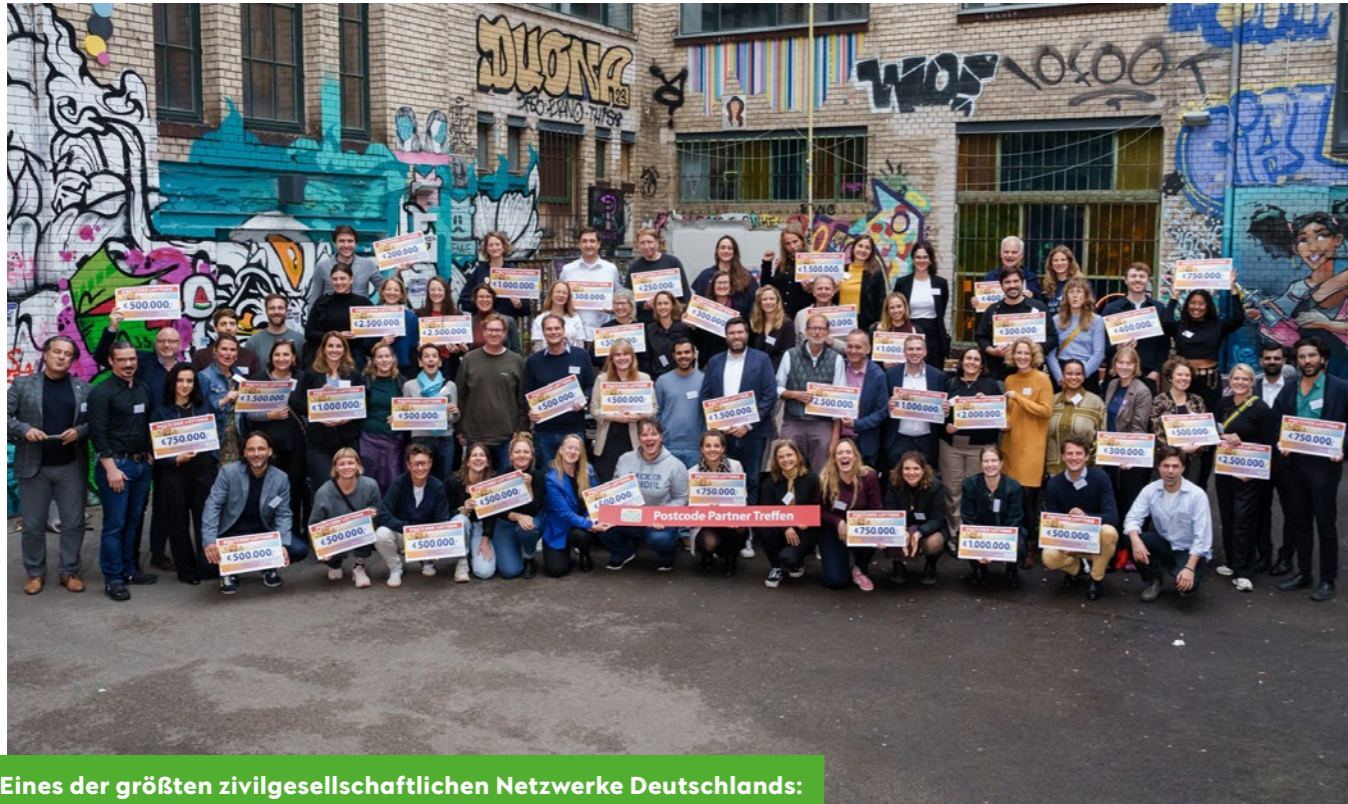
Eines der größten zivilgesellschaftlichen Netzwerke Deutschlands: Gruppenbild mit Postcode Partnern.