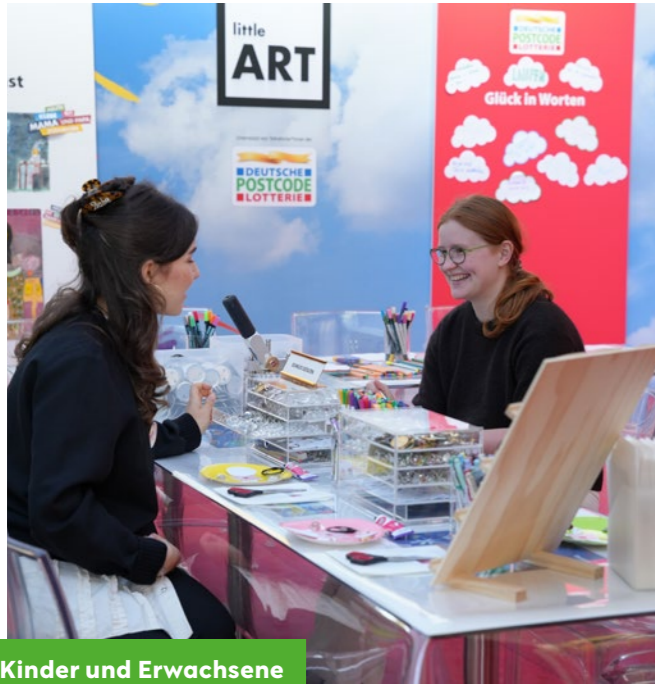
Kinder und Erwachsene konnten kreativ sein.