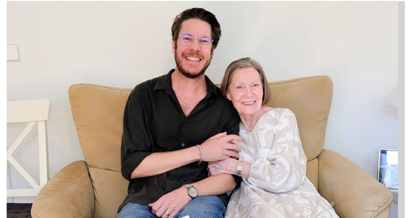
Jung trifft alt: Freunde alter Menschen e. V. vermittelt Partnerschaften zwischen Freiwilligen und Senior*innen.

aus verschiedenen Ländern auf Augenhöhe begegnen, Erfahrungen austauschen und gemeinsam Projekte für eine gerechtere Welt gestalten – und so zeigen, dass Fußball viel mehr sein kann als nur ein Spiel. KICKFAIR e. V. ist seit 2024 Postcode Partner der Postcode Lotterie und wurde 2025 mit 500.000 Euro gefördert.