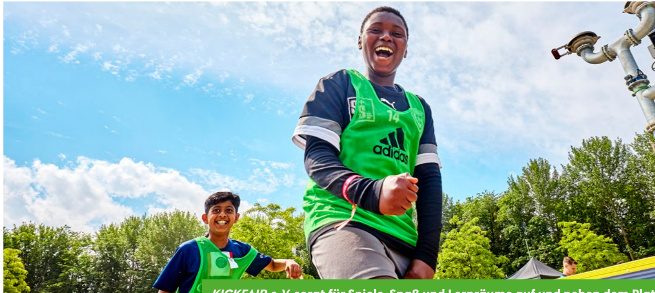
KICKFAIR e. V. sorgt für Spiele, Spaß und Lernräume auf und neben dem Platz.