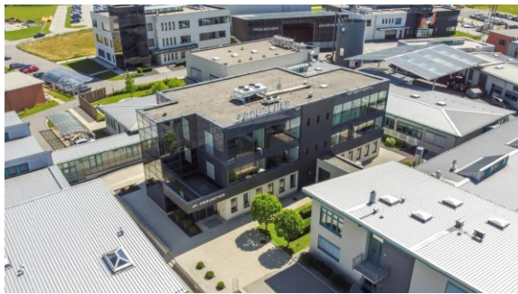
Frauscher Sensor Technology, Standort Österreich