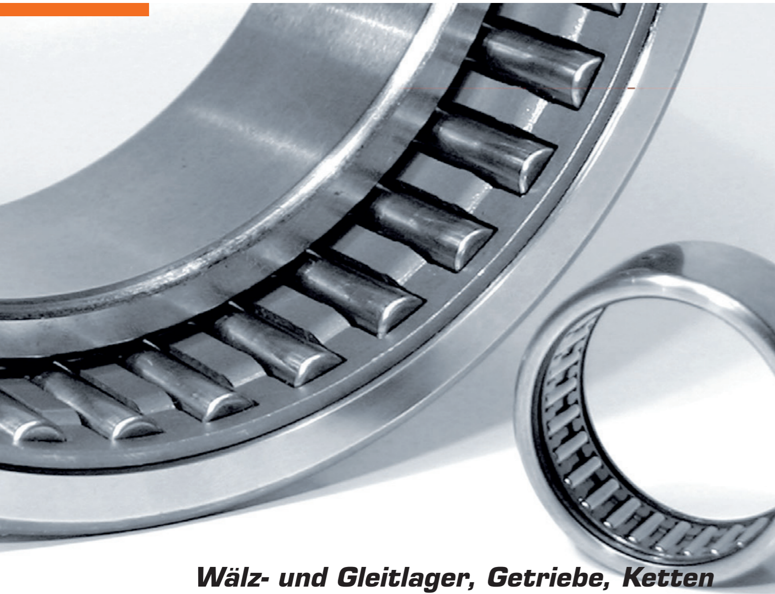
Wälz- und Gleitlager, Getriebe, Ketten Roller and Slide Bearings, Gears, Chains