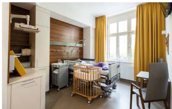
Einzelzimmer im Altbau

Sie möchten noch weitere Informationen zur Geburt im St. Josef Krankenhaus Wien? Dann besuchen Sie unsere Website: