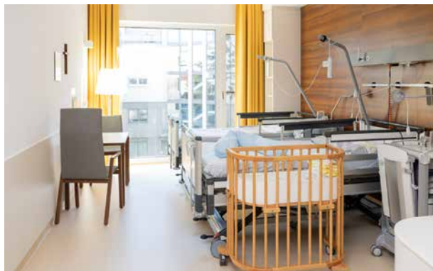
Zweibettzimmer im Neubau

Ein Teil der Sonderklasse-Zimmer befindet sich in unserem modernen Neubau, ein anderer Teil in unserem charmanten Altbau. Alle Zimmer sind freundlich möbliert und klimatisiert.