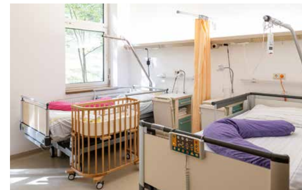
Zweibettzimmer im Altbau