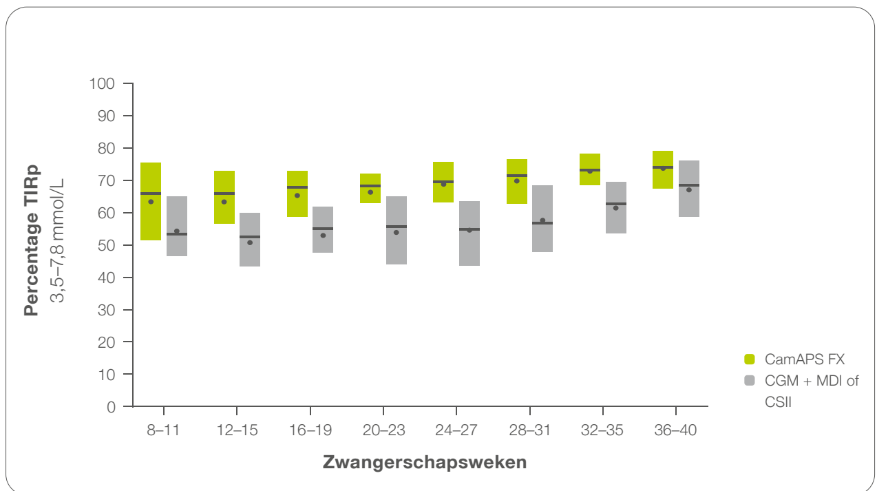
Afb. 4: Percentage binnen het specifieke doelbereik voor zwangerschap.