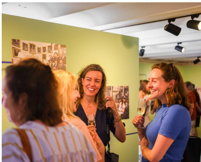
Opening Beelden uit Buitenhof, in het midden fotograaf Ilvy Njokiktjien