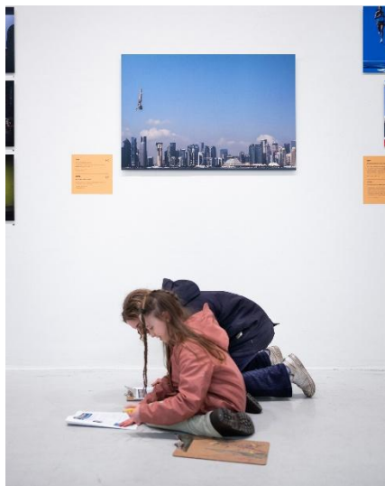
Jonge bezoekers aan het speuren in het museum

Het museum blijft de collectie waar mogelijk uitbreiden met werk dat aansluit bij de inhoudelijke koers van de instelling en dat bijdraagt aan een beter begrip van hedendaagse beeldcultuur. Daarmee investeert Fotomuseum Hilversum niet alleen in het heden van de fotografie, maar ook in de toekomst van fotografisch erfgoed.