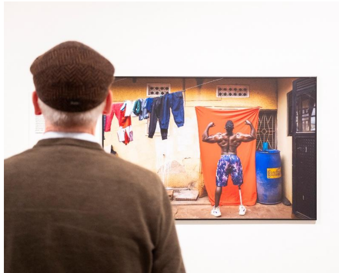
Bezoeker tijdens World Press Photo

In de komende jaren blijft Fotomuseum Hilversum werken aan het versterken van zijn programma, het vergroten van zijn publieksbereik en het verder ontwikkelen van zijn rol als platform voor fotografie. Daarbij blijft het museum inzetten op artistieke kwaliteit, maatschappelijke betrokkenheid en organisatorische duurzaamheid. Vanuit die combinatie kijkt Fotomuseum Hilversum met vertrouwen vooruit.