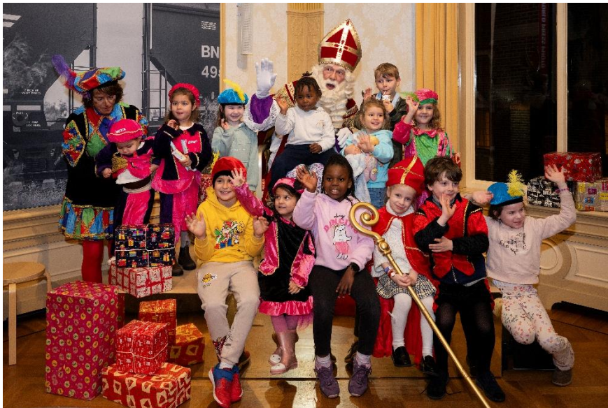
Sinterklaas en Piet op bezoek in Fotomuseum Hilversum.

De samenwerking met tv-programma's die inhoudelijk in het verlengde liggen van de fotografische focus van het museum is zeer waardevol voor de positionering van het museum.