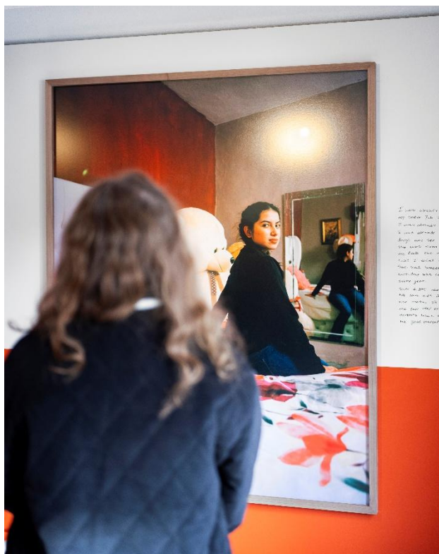
Bezoeker bij een foto tijdens de tentoonstelling I went on a Holiday to the Country You Fled From