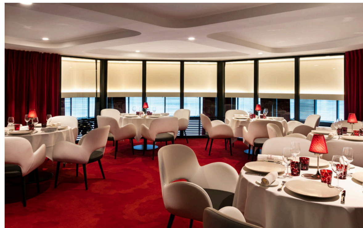
SALON DU PAVILLON DU LAC