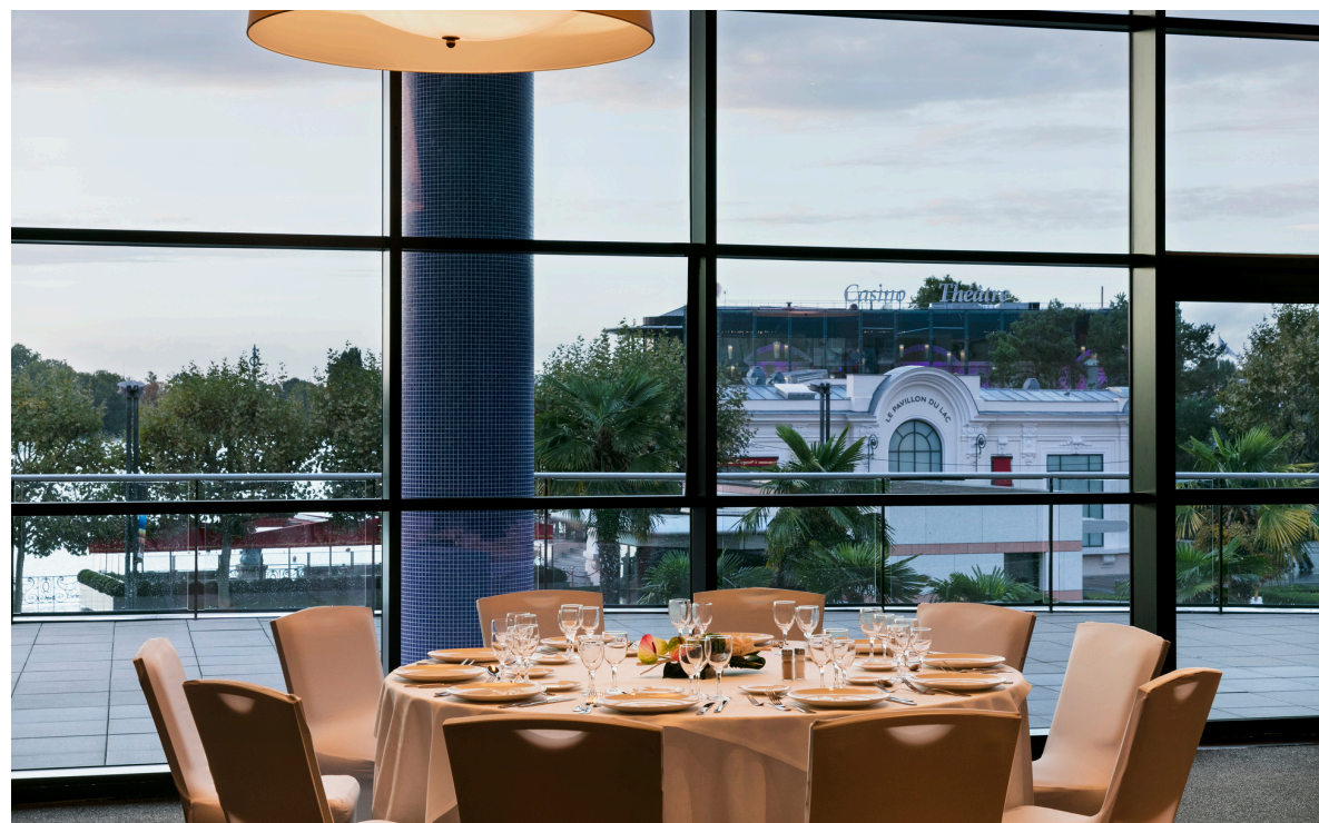
LES PERGOLAS NOVAS