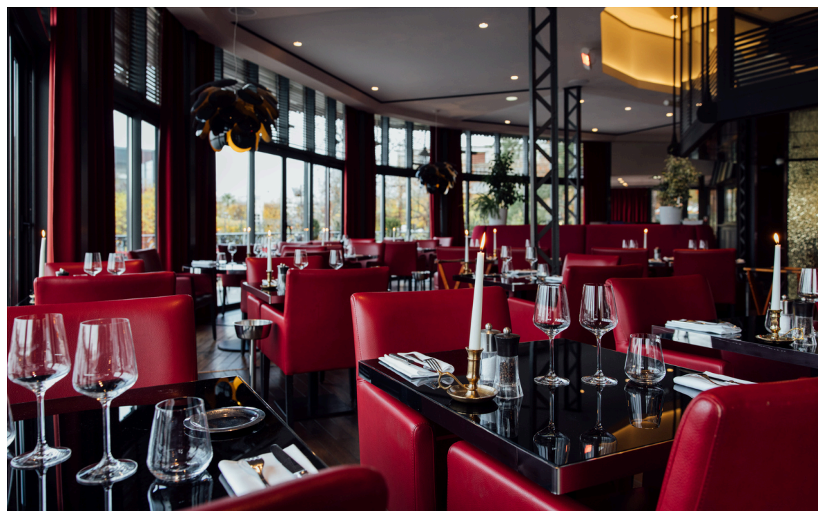
LE PAVILLON DU LAC