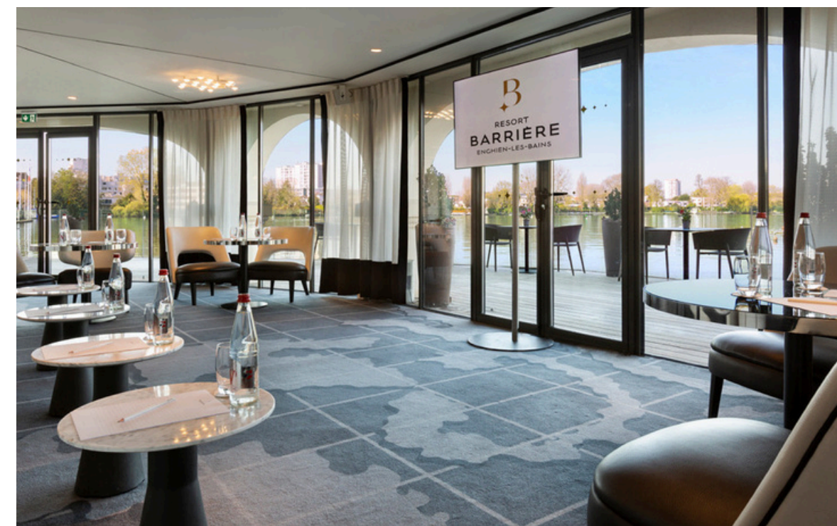
LE BAR DU PAVILLON DU LAC