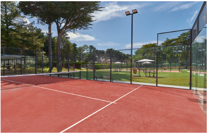
PADEL LA BAULE