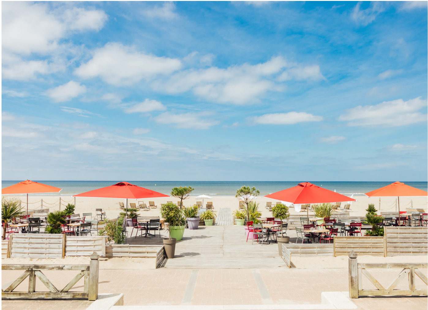
VILLA SUR LA PLAGE