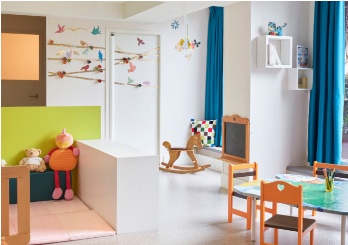
KID'S CLUB LE ROYAL LA BAULE