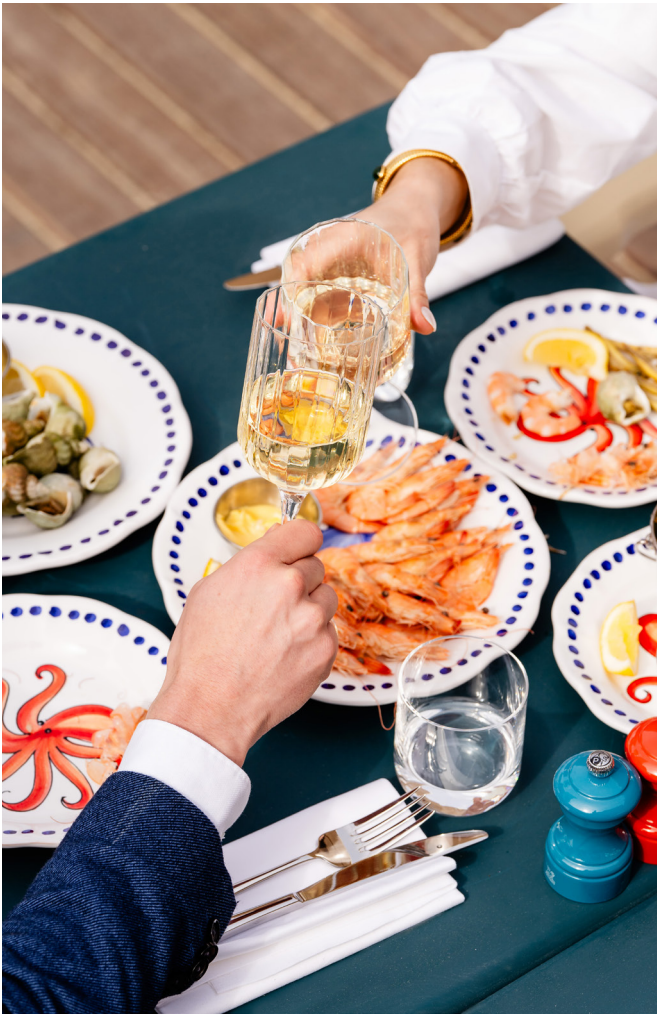
BAR DE LA MER