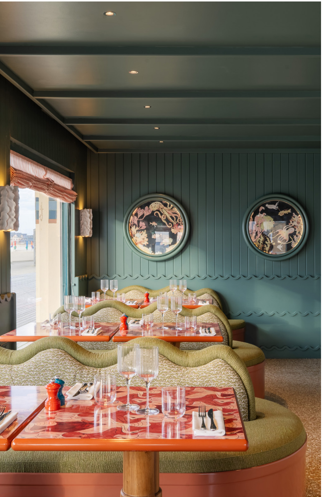
BAR DE LA MER