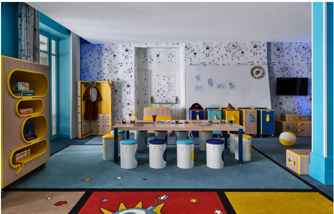
KID'S CLUB HERMITAGE