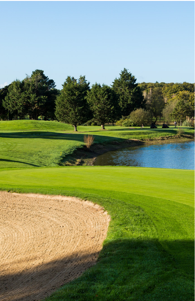
GOLF INTERNATIONAL BARRIÈRE LA BAULE