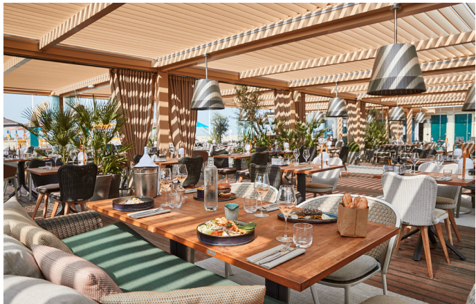
BAR DU SOLEIL