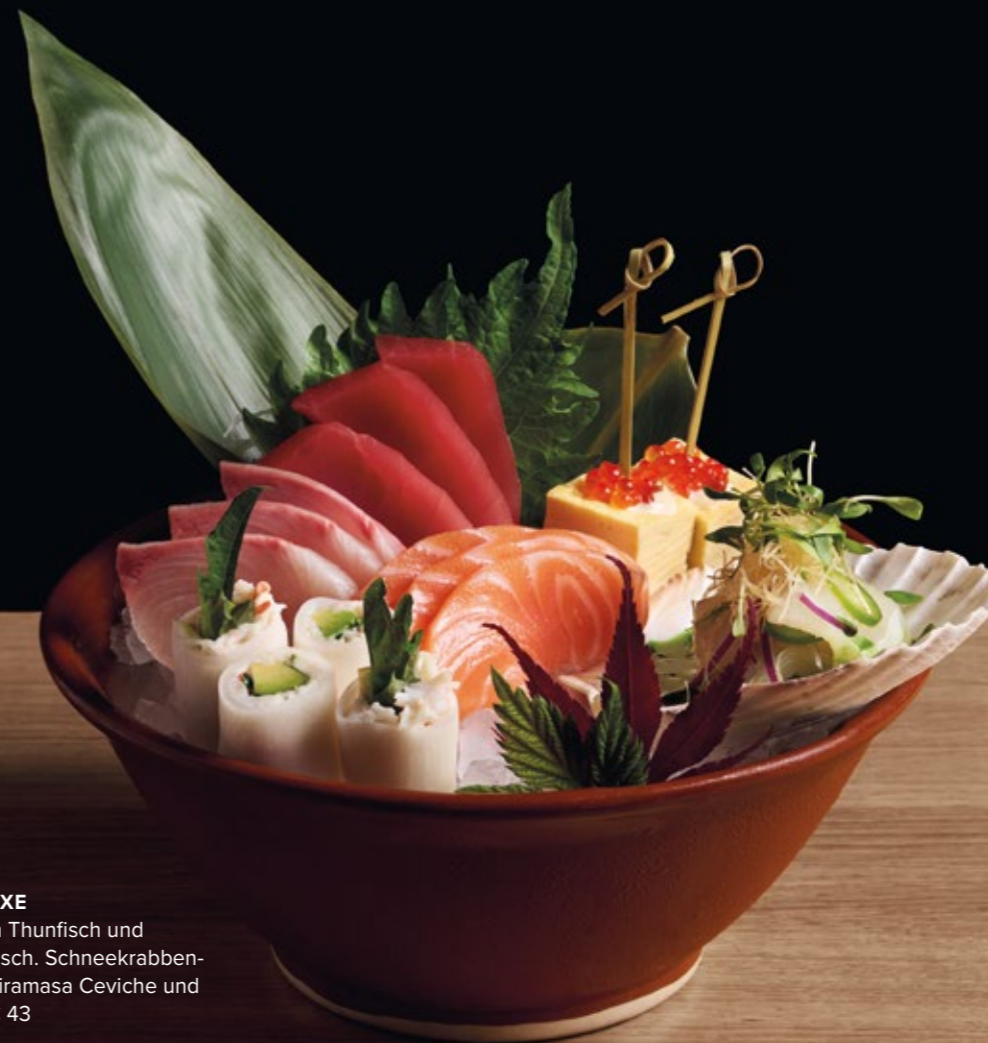
SASHIMI DELUXE Lachs, Yellowfin Thunfisch und Hiramasa Kingfisch. Schneekrabben- Daikon-Rolle, Hiramasa Ceviche und Tamago Ikura € 43