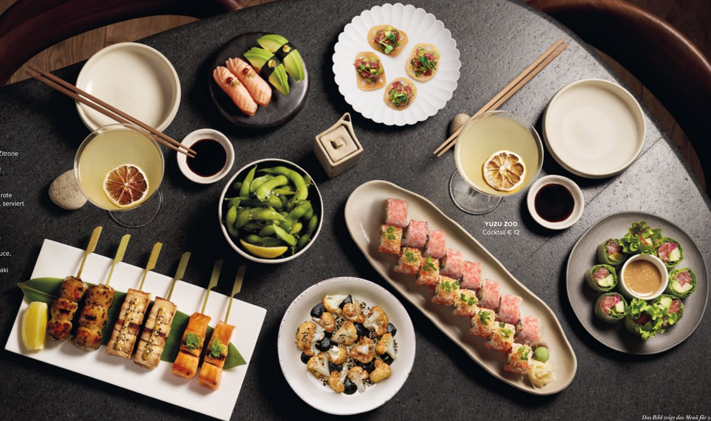
YUZU ZOO Cocktail € 12