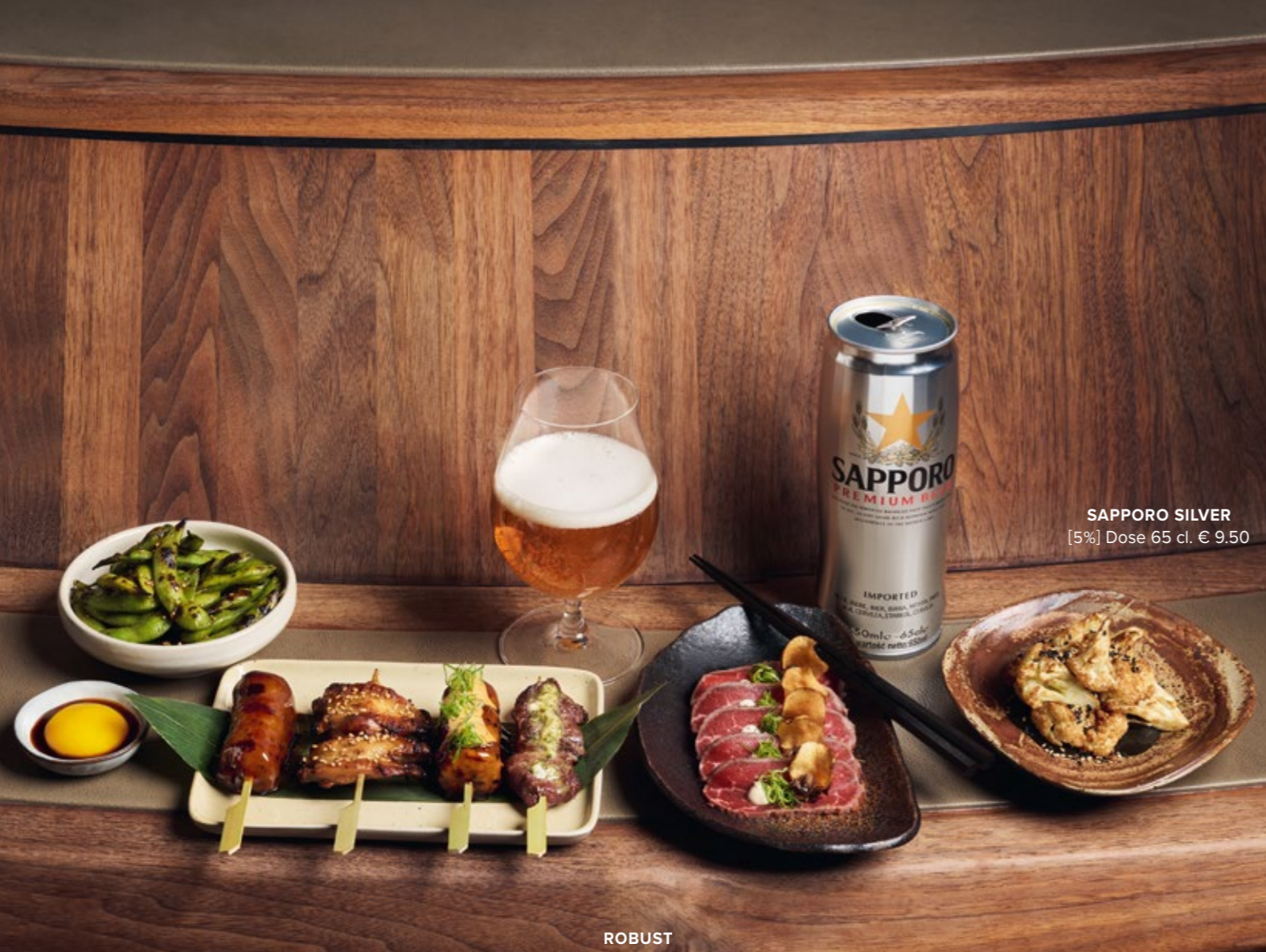
SAPPORO SILVER [5%] Dose 65 cl. € 9.50