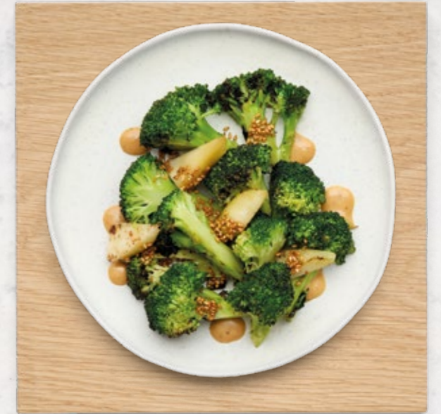
BROCCOLI Gegrillter Broccoli mit spicy Goma. Vegan | € 7.20