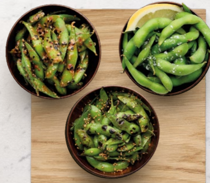
EDAMAME BEANS | Vegan Spicy Miso & Sesam € 6.50. Gegrillt, Supreme Soja & Soja Sesam € 6.50. Meersalz & Zitrone € 6.50