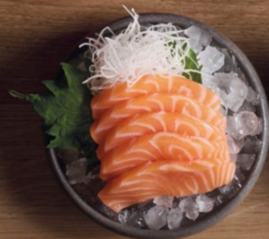
SHAKE Lachs € 12