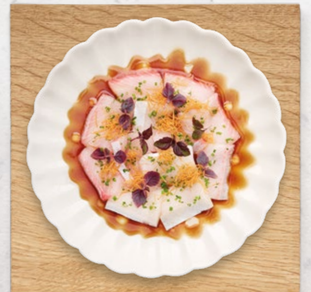
HIRAMASA KATAIFI Hiramasa, knusprigen Kartoffeln, Shiso, Trüffelöl, Schnittlauch & Ponzu € 16.20