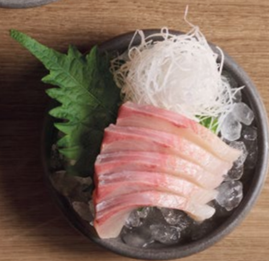
HIRAMASA Hiramasa Kingfisch € 16