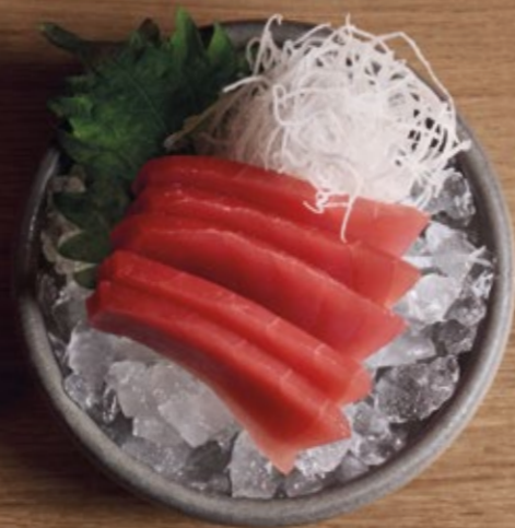
MAGURO Yellowfin Thunfisch € 15