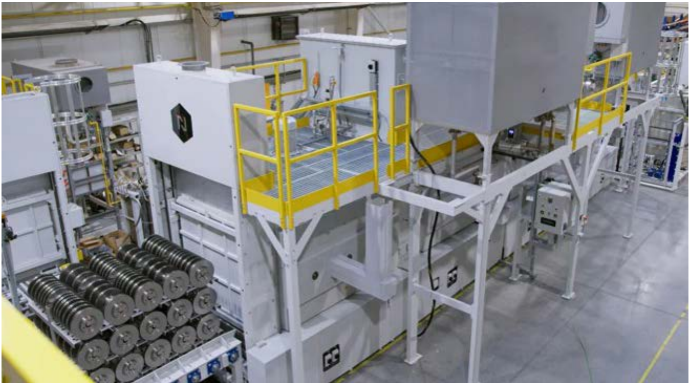
Bild 2: Thermoprozessanlage für den FNC-Prozess von Bremsscheiben