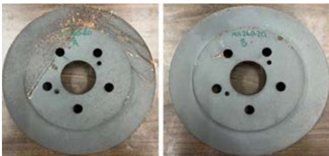
Bild 3: SAE J2334 nach 36 Zyklen - links: FNC-ONC (30–35 % Korrosion) vs. rechts: FNC-Smart-ONC (1 % Korrosion) [14]