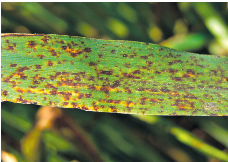
Gegen Ramularia rückt man in der Gerste im Risikogebiet am besten doppelt aus.

kämpfungsstrategie oft vom ortsüblichen Verfahren ab. Der ideale Einsatzzeitpunkt liegt hier eindeutig bereits zu Beginn der Schossphase im Stadium BBCH31/32 mit entsprechend wirksamen Präparaten. Grundsätzlich kann hier zwischen günstigen Spezialprodukten (z. B. Wirkstoff Cyprodinil) oder breiter wirksamen Azolkombinationen unterschieden werden. Letztgenannte wirken dann auch gegenüber bereits latent vorhandenen Blattkrankheiten (Netzflecken, erste Rostinfektionen, Septoria etc.).