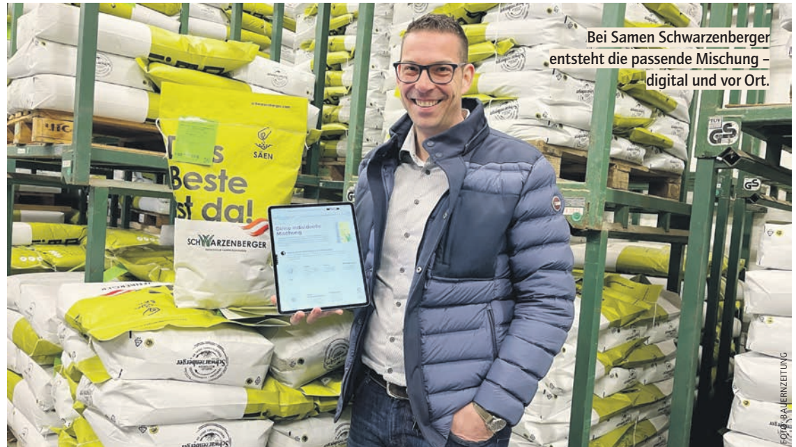
Bei Samen Schwarzenberger entsteht die passende Mischung – digital und vor Ort.

Schritt für Schritt werden die wichtigsten Informationen abgefragt: vom Betriebszweig über die Lage der Grünflächen bis hin zur Beschaffenheit des Bodens. Standortdaten wie der Jahresniederschlag werden automatisch per GPS erfasst und einbezogen, aktuelle Wetterdaten ergänzen die Analyse. Künftig sollen diese Informationen in einem digitalen Dash-