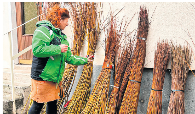
Für einen größeren Korb benötigt man etwa 100 Weidenruten.

Der Weg von der frisch geschnittenen Weidenrute bis zum fertigen Korb erfordert Geduld und handwerkliches Geschick. Zunächst müssen die Ruten sortiert und vorbereitet