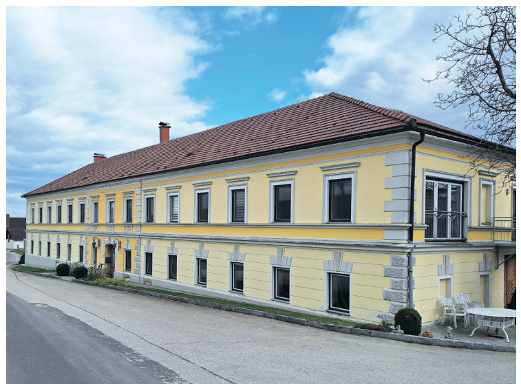
Der für die Region typische Vierkanthof prägt seit Jahrhunderten das Ortsbild. Nach wie vor bildet er das Herzstück des Bauernhofs.