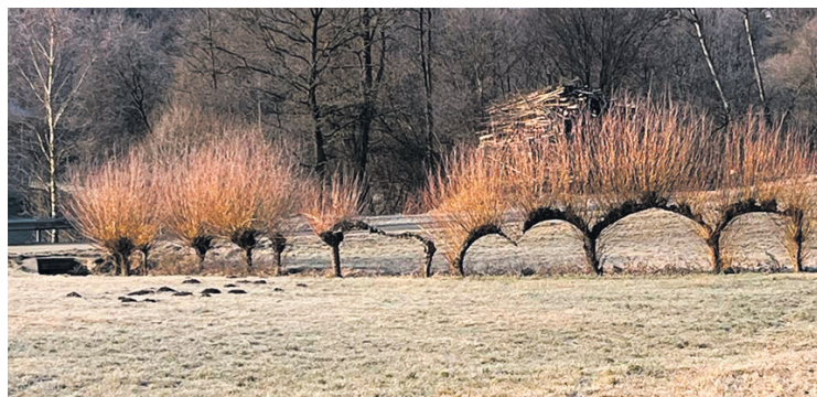
Die eigens für die Beerntung gezogenen Bäume werden Kopfweiden genannt.