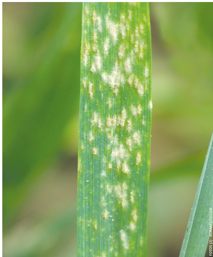
Der echte Mehltau ist einzig bei Weichweizen zu vernachlässigen.

Ährenfusariosen dürfen aber nicht nur auf die Durumweizenproduktion reduziert werden, denn auf einem erheblichen Teil der österreichischen Maisfläche wird im Folgejahr Weizen oder Triticale angebaut. Im Vorjahr war dies auf 295.000 Hektar der Fall. Aus arbeitswirtschaftlichen Gründen steigt natürlich auch der pfluglos bewirtschaftete Anteil dieser Flächen und damit exponentiell auch das Fusariumrisiko. Natürlich ist beim Weizen- oder Triticaleanbau nach Mais bei