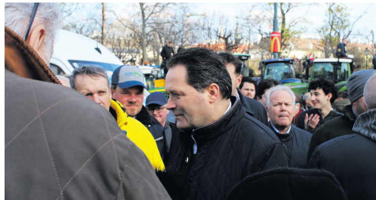
Landwirtschaftsminister Totschnig suchte das Gespräch mit den Bauern.