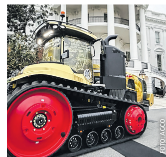
673 Fendt-PS in Washington

Anlässlich des 250-jährigen Jubiläums der amerikanischen Landwirtschaft trafen sich Agco-Führungskräfte im Weißen Haus in Washington mit Präsident Donald Trump und Vertretern der Branche. Auch ein goldener Raupentraktor war bei den Feierlichkeiten dabei, ein Fendt-1167 Vario MT mit 673 PS Maximalleistung.