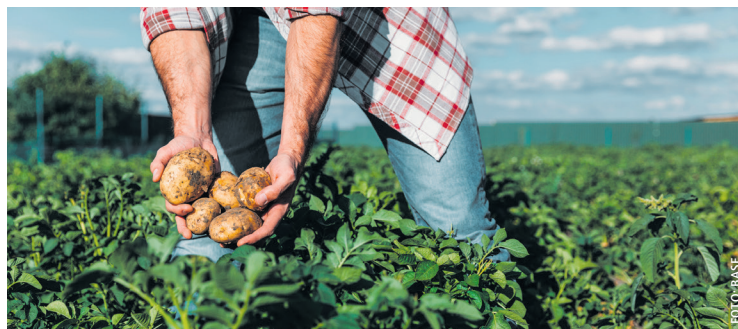
Ein hochmodernes Wirkstoff-Duo, das sich flexibel einsetzen lässt.

Enervin® Pro kombiniert Ametoctradin (Initium®) mit Kaliumphosphonat (KHP) – zwei Wirkmechanismen, die sich ergänzen. Ametoctradin legt sich schützend auf die Blattoberfläche und verhindert, dass sich der Erreger weiterentwickelt. Es blockiert die Energieproduktion der Pathogene und stoppt ihre Vermehrung im Keim. Kaliumphosphonat dringt rasch in das Blattgewebe ein, wird systemisch verteilt und aktiviert die eigenen