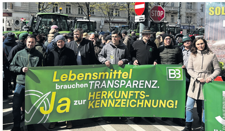
Der Ruf nach einer verpflichtenden Herkunftskennzeichnung einte alle Beteiligten.