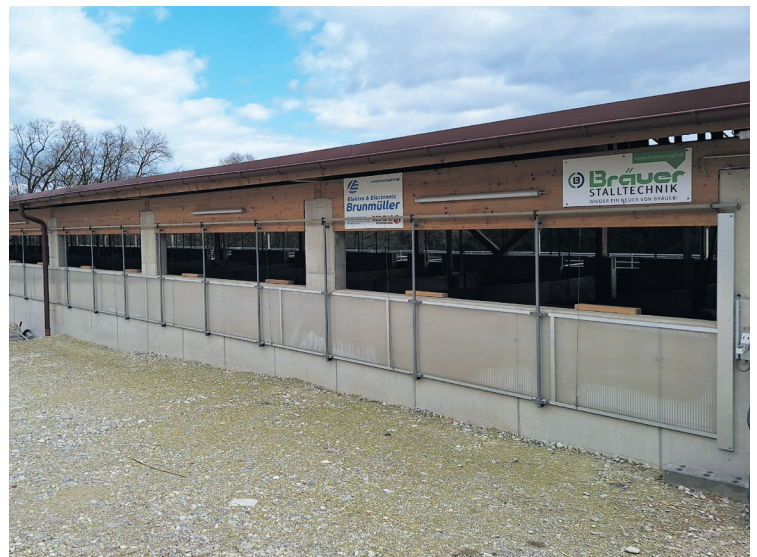
Der im Vorjahr bezogene Tierwohlstall beim „Ferdlbauer“ bietet den Schweinen Außenklimareize, Einstreu und jede Menge Platz.