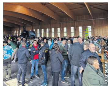
Großer Andrang bei der Veranstaltung