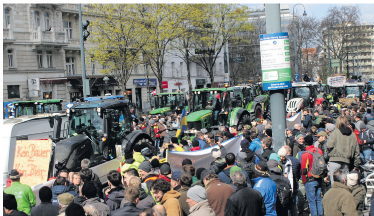
Einen Kilometer maß der Zug aus Traktoren. Im Stillstand, wohlgeernt.