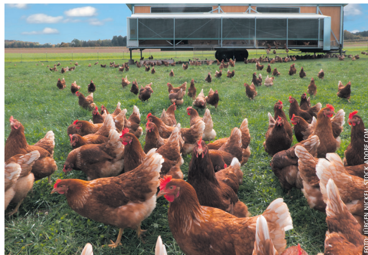
Auch entlang von Wasserläufen darf Hausgeflügel nun wieder ins Freie.

■ Die Reinigung und Desinfektion der Beförderungs-