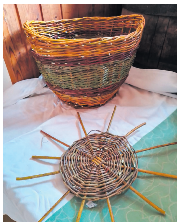
Begonnen wird mit dem Korbboden.