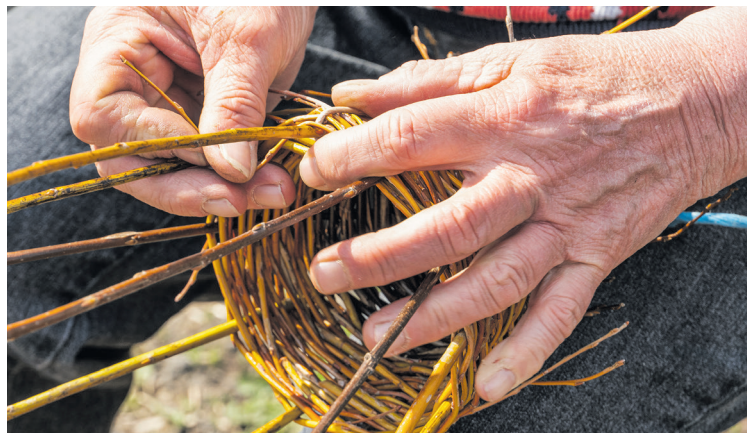
Beim Flechten bedarf es gewisser Geschicklichkeit, um die Form zu erreichen.

stötter. Korbflechten verbindet bäuerliche Kultur und handwerkliches Wissen. Gerade in Zeiten zunehmender Nachhaltigkeitsdebatten gewinnt das alte Handwerk wieder an Bedeutung. Körbe aus Weide sind langlebig, reparierbar und vollständig aus heimischen Rohstoffen gefertigt.