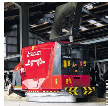
Der Triomatic WB 2-300 im Einsatz

Dank neuer Lithium-Batterietechnik, einem Ladeschiensystem in der Futterküche und dem Dual-Flow-Mischprinzip mit zwei Schnecken soll der Roboter eine konstante Mischqualität „ohne Kompromisse“ ermöglichen. Während zuvor eine maximale Steigung von fünf Prozent als bewältigbar galt, wird beim neuen WB 2-300 Fütterungsroboter die maximale Steigung mit zehn Prozent angegeben. Laut Firmenangaben liegt die Mischgeschwindigkeit bei bis zu 35 U/min und die Kapazität bei bis zu ca. 400 GVE (abhängig von der Stall-situation). Anlässlich „20 Jahre Triomatic“ wirbt das Unternehmen mit Angeboten.