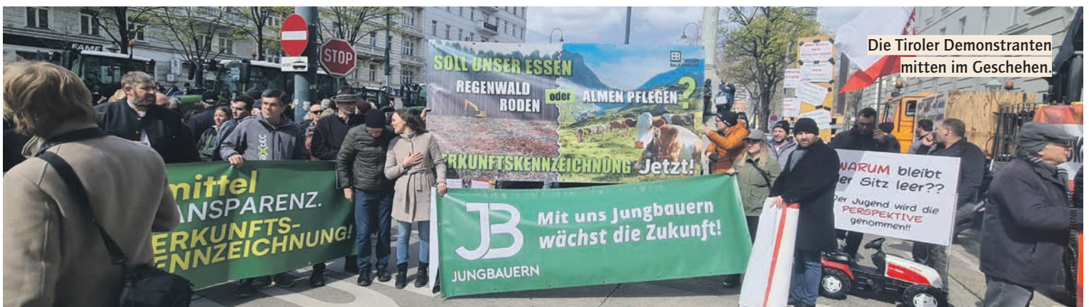
Die Tiroler Demonstranten mitten im Geschehen.