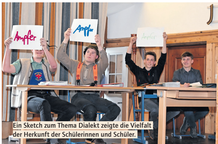
Ein Sketch zum Thema Dialekt zeigte die Vielfalt der Herkunft der Schülerinnen und Schüler.