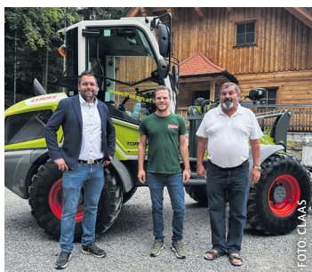
Top-Maschinen für Sturmberger