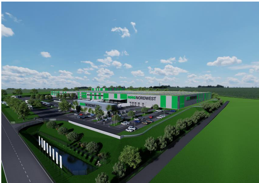
Das neue NORDWEST-Zentrallager wird über 72.000 Quadratmeter Hallenfläche verfügen. (Grafik: NORDWEST)

Herausgeber: NORDWEST Handel AG Robert-Schuman-Straße 17 44263 Dortmund Telefon: +49 (0)231 - 2222 - 3001 http://www.nordwest.com