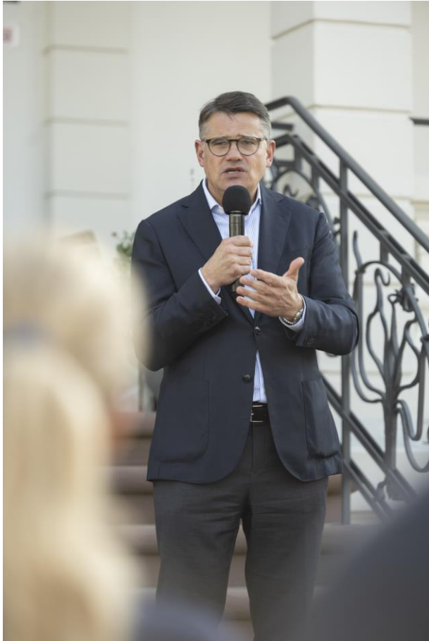
Boris Rhein, Ministerpräsident Hessen