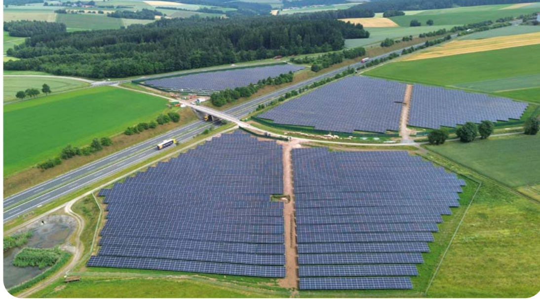
Die PV-Anlage in Wernberg