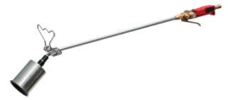
Für unseren RoTitan Anwärmbrenner Art.Nr. 1500004667