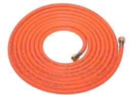
In Verbindung mit unseren elastischen 6 m Gummischlauch Art.-Nr. 1500004792