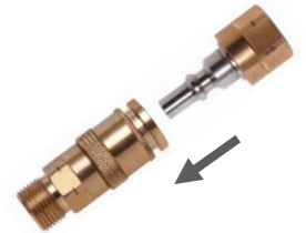
PUSH-System: schnelles ein- und auskuppeln möglich