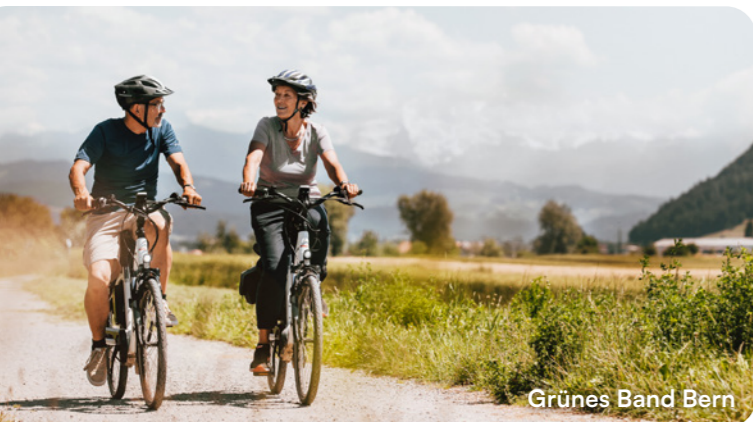
Grünes Band Bern

Welcome to the cycling tours in the region of Bern. Discover the diverse landscape around the federal city on our ten highlight routes on two wheels. Enjoy the ride!