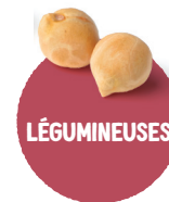
LÉGUMINEUSES Lentilles ( rouges, corail, beluga... ), pois chiches, haricots blancs, haricots rouges, fèves, haricots borlotti, ...