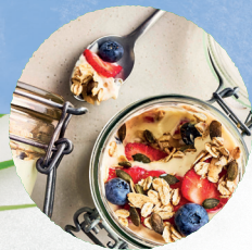
Votre GRANOLA avec une alternative végétale au yaourt

Manger durablement n'est pas une question de tout ou de rien ! On peut prôner le végétal, sans pour autant supprimer entièrement les produits de source animale.