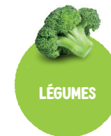
LÉGUMES Carottes, poireau, tomates, céleri, choux, épinards, concombre, radis, haricots princesse...