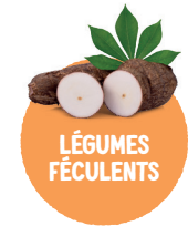
LÉGUMES FÉCULENTS Pomme de terre, manioc