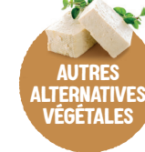
AUTRES ALTERNATIVES VÉGÉTALES Tofu, seitan, substituts de viande à base de mycoprotéines...