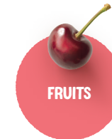
FRUITS Pomme, poire, raisins, fraises, cerises, framboises...