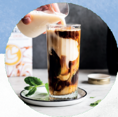
Une goutte de boisson végétale dans votre CAFÉ