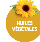
HUILES VÉGÉTALES Tournesol, olive, colza, arachide...