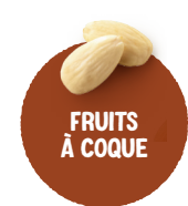
FRUITS À COQUE Noix, noisettes, amandes, arachides, pistaches...