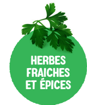
HERBES FRAICHES ET ÉPICES Thym, laurier, persil, coriandre, poivre, cerfeuil, curcuma, curry, marjolaine...