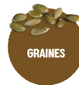
GRAINES de sésame, de lin, de tournesol, de courge...