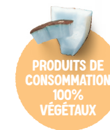
PRODUITS DE CONSOMMATION 100% VÉGÉTAUX Boissons végétales, desserts végétaux, alternatives végétales à la crème... à base d'amandes, d'avoine, de noix de coco...