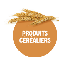
PRODUITS CÉRÉALIERS Farines, pains, riz, pâtes, boulghour, avoine, quinoa...