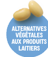
ALTERNATIVES VÉGÉTALES AUX PRODUITS LAITIERS Produits à base de soja enrichis en calcium