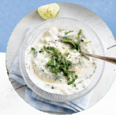
Une SAUCE à base d'une alternative végétale à la crème