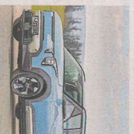
Kia EV2: Der Kleinste hat das Zeug, ein Großer zu werden. SEITE 4