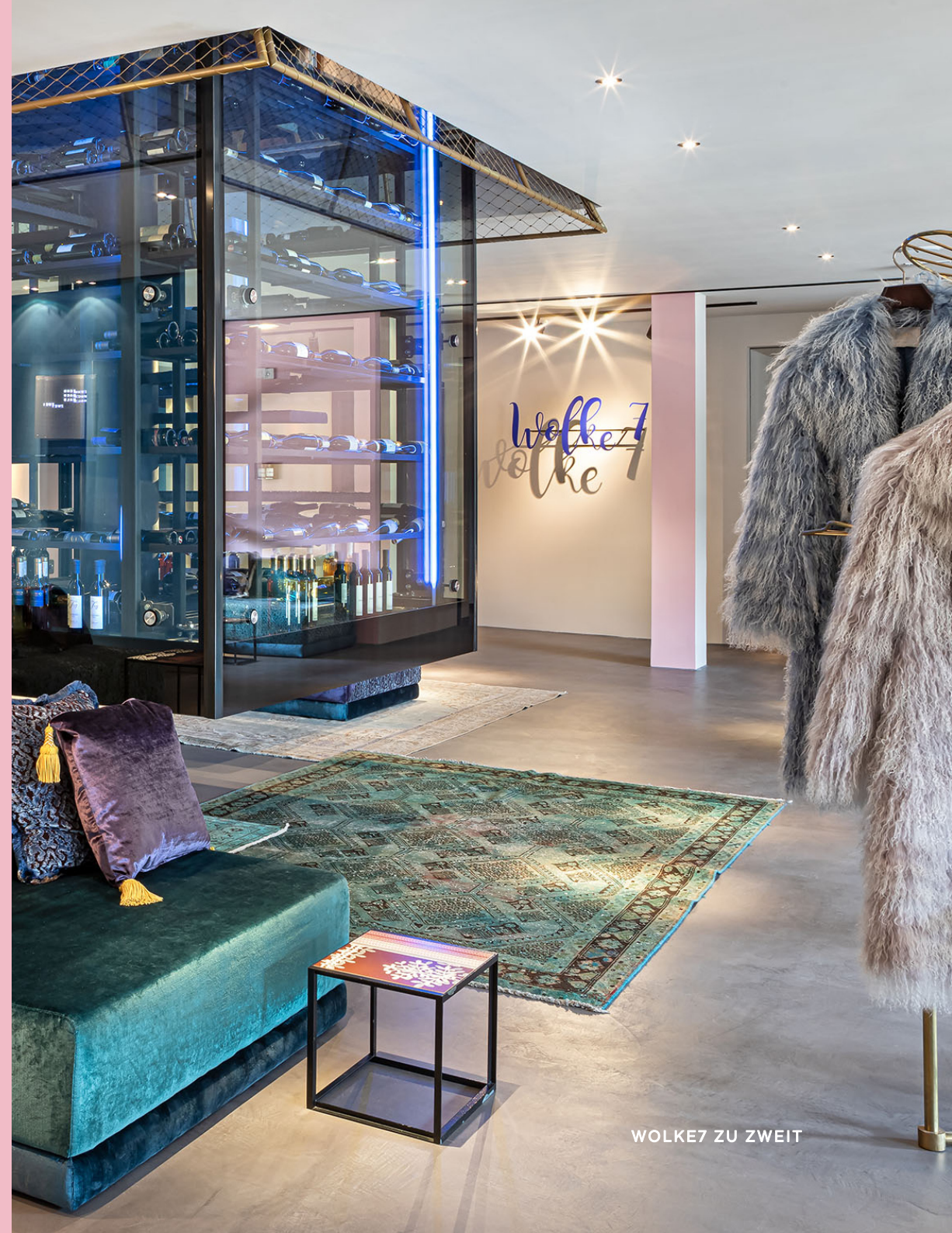
WOLKE7 ZU ZWEIT

GAMS zu zweit **** superior Platz 44 • 6870 Bezau, Österreich +43 5514 2220 • www.hotel-gams.at