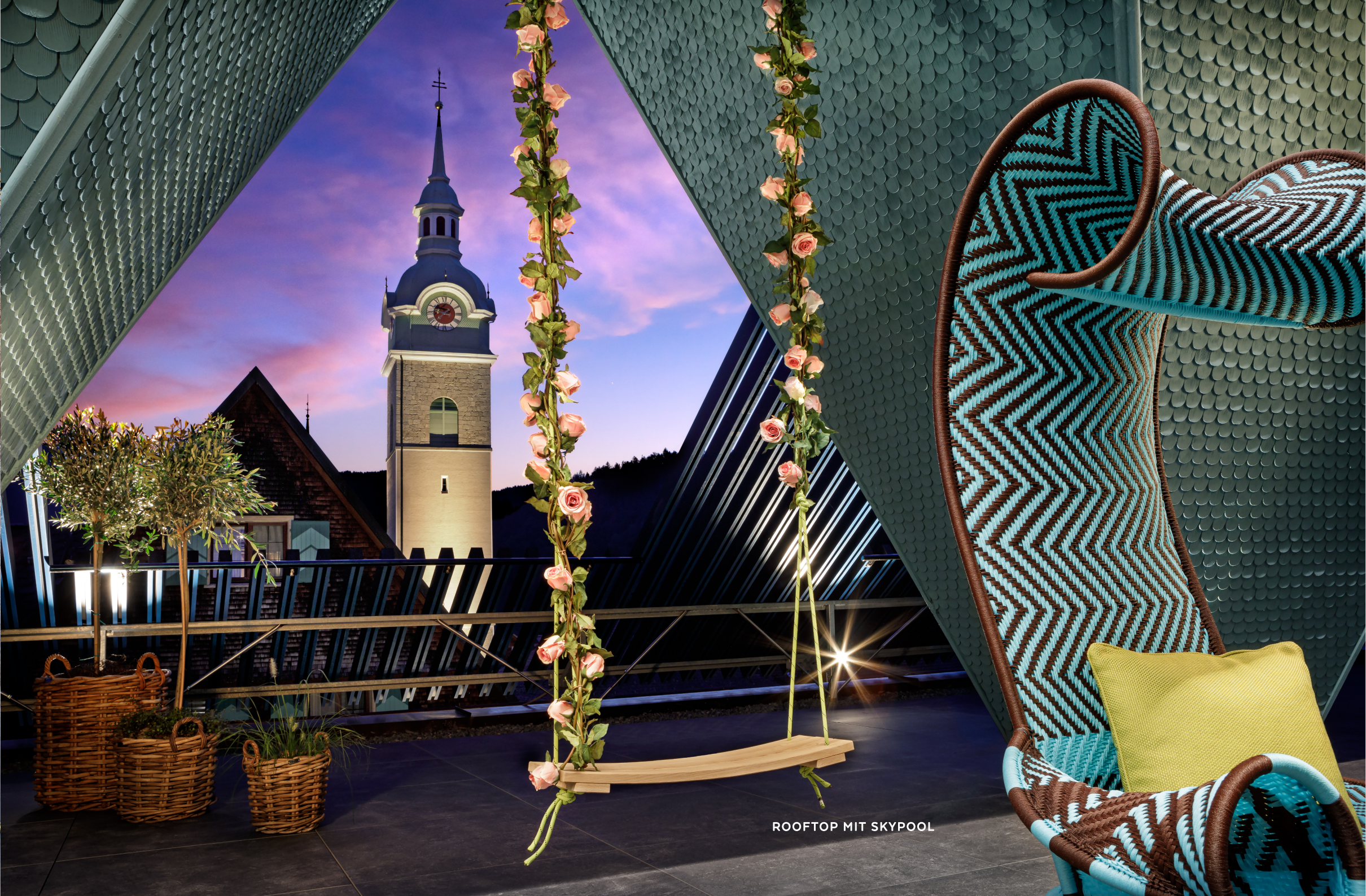
ROOFTOP MIT SKYPOOL