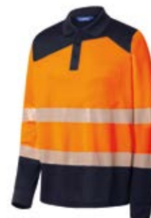
Ref. : 81001004__