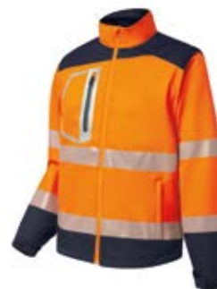
Ref. : 81001010__