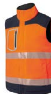
Ref. : 81001014__