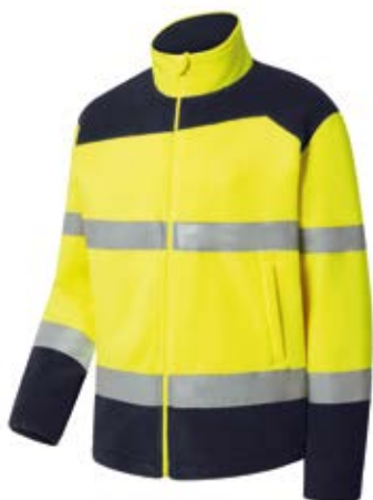
Ref. : 81001007__