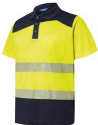
Ref. : 81001001__