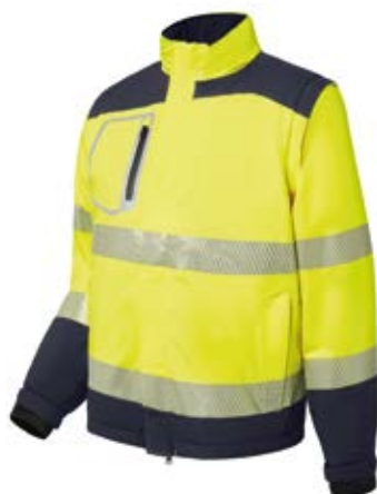
Ref. : 81001015__