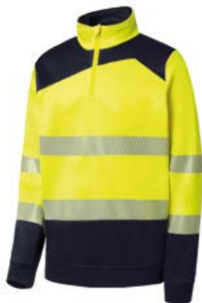
Ref. : 81001005__