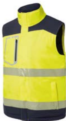
Ref. : 81001013__