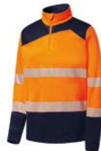
Ref. : 81001006__