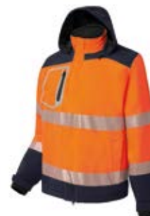
Ref. : 81001018__