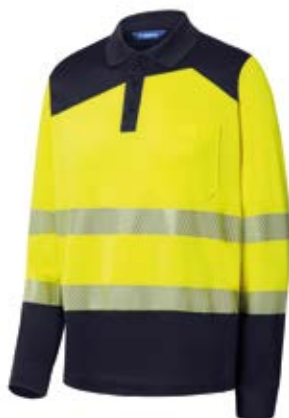
Ref. : 81001003__