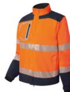
Ref. : 81001016__