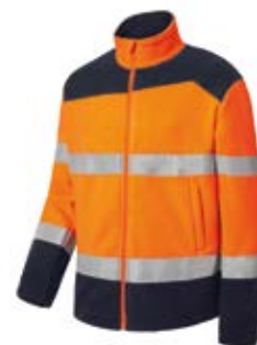
Ref. : 81001008__