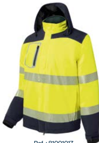
Ref. : 81001017__