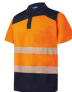
Ref. : 81001002__