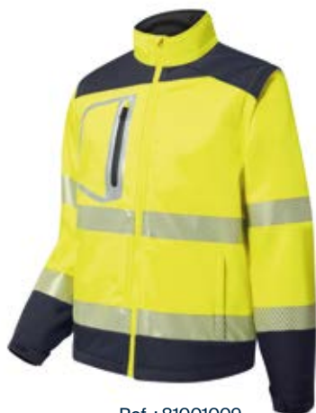
Ref. : 81001009__