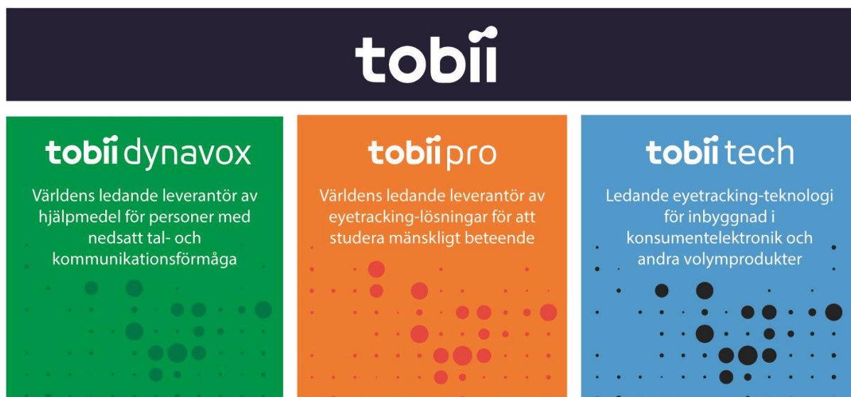
Omsättning per affärsområde Kv 1, 2017

Koncernen har över 750 anställda och täcker världsmarknaden genom egna kontor i Sverige, USA, Kina, Japan, Norge, Tyskland, Storbritannien, Sydkorea och Taiwan samt genom ett globalt nätverk av återförsäljare. Tobii har sitt huvudkontor i Danderyd och är sedan april 2015 noterat på Nasdaq Stockholm.