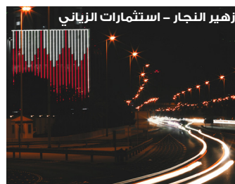
زهير النجار - استثمارات الزياتي

Service, sacrifice, and strength - the silent rhythm keeping our community safe.