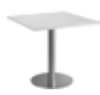
Tisch, 80 x 80 cm, chrom