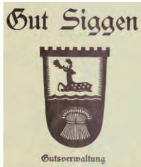
Wappen von Siggen, wahrscheinlich von A. Paul Weber entworfen