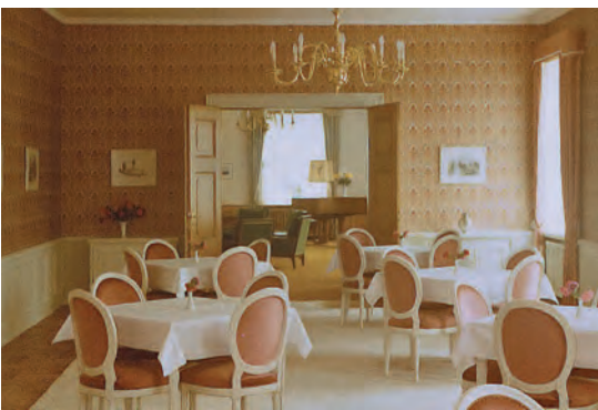
Der Speisesaal im Herrenhaus nach der Sanierung, 1970er Jahre