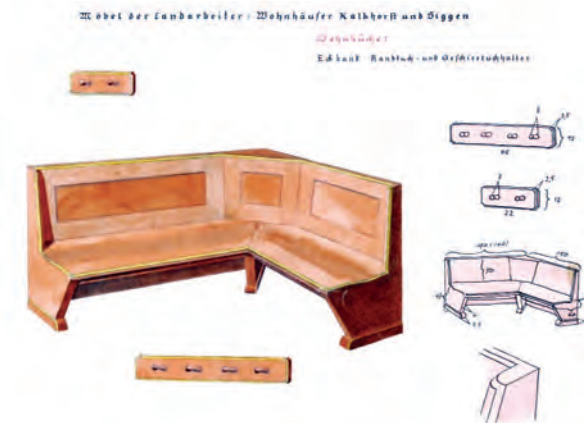
A. Paul Weber, Entwurf einer Sitzbank für die Wohnhäuser der Landarbeiter, 1933