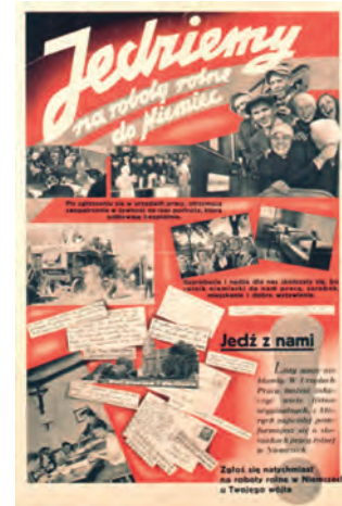
Aufruf zum Arbeitseinsatz in Deutschland in polnischer Sprache, vor 1942

Kriegsgefangene im Dienst, ein erhaltenes Foto zeigt möglicherweise italienische, französische und jugoslawische Kriegsgefangene. Die 1967 verfasste Chronik von Siggen nennt für Siggen ebenfalls russische Kriegsgefangene. Wie in Kalkhorst wurden die sowjetischen Soldaten getrennt in einer Baracke untergebracht. Die Franzosen seien »überall wohlgekommen« gewesen, die