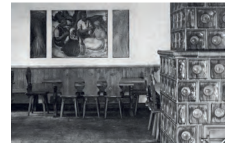
Die Meierei auf Siggen mit der von A. Paul Weber entworfenen Einrichtung und einem seiner Ölbilder, 1933