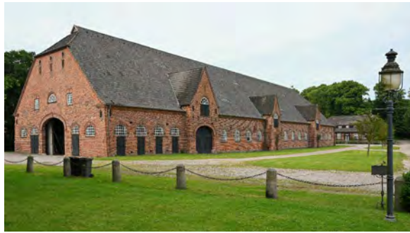
Neue Scheune von 1934

Für den Getreideanbau geeignetes Grünland ließ Toepfer umbrechen, so dass sich die Ackerfläche deutlich erweiterte. Tiefliegendes Grünland, das regelmäßig überschwemmt wurde, erhielt 1936 eine Drainage, so dass trotzdem genügend Grünland für die Viehwirtschaft blieb. Die Gräser, aus denen das Heu für das Vieh gewonnen wurde, wuchsen auch nach der Drainage aus der alten, wertvollen Grasnarbe. Toepfer hatte eigens einen Agrarwissenschaftler aus Österreich engagiert, der diese Maßnahme begleitete. Neue Silos für das Grünfutter entstanden, kurios überdeckt von einem Reetdach: ein wenig überzeugender Versuch, moderne Erscheinungsformen der Architektur aus dem Gutsbild zu bannen. Eine Krananlage für das Umheben von Dung, ein Maschinenschuppen und eine Reparaturwerkstatt bildeten weitere Modernisierungen.