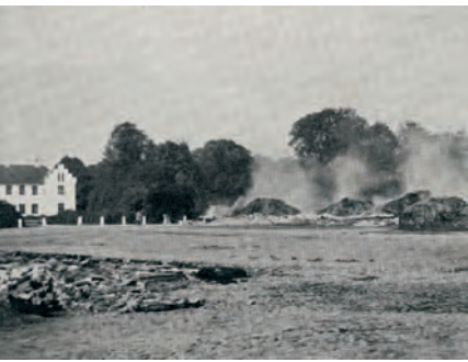
Der Brand der Scheunen, 1934