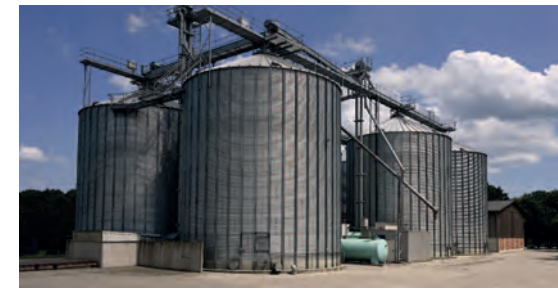
Siloanlage mit integrierter Getreidetrocknung

Eine große Investition in die Zukunft der Landwirtschaft auf dem Gut Siggen war der Bau der neuen Siloanlage mit integrierter Getreidetrocknung. 1934 hatte Alfred Toepfer ohne Erfolg versucht, neue Silos unter einem Reetdach zu verstecken. Heute stehen die silbernen Silos als selbstverständliches Element einer modernen Landwirtschaft frei unter dem Himmel Ostholsteins. Wenige Arbeitskräfte reichen heute für die Arbeit auf den Feldern aus, was nur mit dem Einsatz moderner Technik möglich ist. Einige der Arbeiterhäuser, die Alfred Toepfer seit den 1930er Jahren errichteten oder modernisieren ließ und für die durch die Rationalisierung der Gutswirtschaft kein Bedarf mehr bestand, wurden verkauft, andere dienen heute als Ferienunterkünfte.