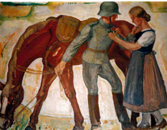
A. Paul Weber 1933, »Abschied«, in der Burgstube

Auf Siggen erinnert vor allem die »Burgstube« in einem der Häuser an der Gutszufahrt an diese Zeit. A. Paul Weber malte 1933 einen ganzen Zyklus von Personen, die zu einer typischen Dorfgemeinschaft gehörten. Auf 17 Bildern an den vier Wänden der Burgstube finden sich neben Bauer und Bäuerin die Handwerker, der Postbote und der Lehrer, aber auch die Hebamme und die Spinnerin. Auch eine Szene mit einem Soldaten, der sich von seiner Liebsten verabschiedet, ist Teil des Zyklus. Das Soldatsein gehörte zum Dorfleben, das zeigen die Register des für Siggen zuständigen Standesamtes mit den Einträgen aus dem Ersten und Zweiten Weltkrieg.