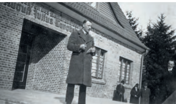
Eröffnung des von Toepfer finanzierten Langbehnhauses auf dem Kniusberg in Nordschleswig 1931

den Universitäten, die als Verteiler der Kulturpreise auftraten, sowie Ministerien und anderen staatlichen Einrichtungen zahlreiche Kontakte. Immer war eine Genehmigung zur Preisvergabe notwendig, eine unabhängige Arbeit der Stiftung F.V.S. im Dritten Reich war nicht möglich. Da die Stiftung im Bereich der »Volkstumsarbeit« ähnliche Ziele wie der nationalsozialistische Staat verfolgte – eine Anbindung deutschsprachiger