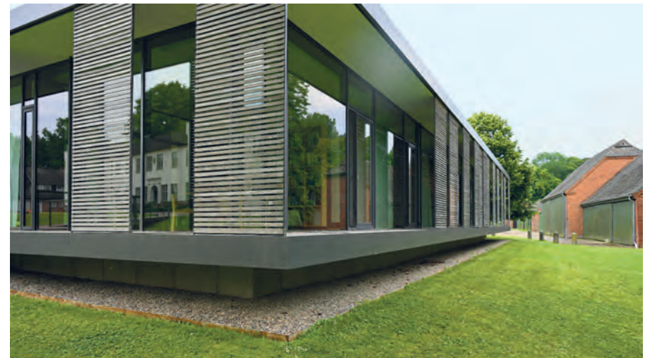
Seminargebäude Gut Siggen

Die Arbeit der Alfred Toepfer Stiftung F.V.S. war seit Mitte der 1930er Jahre zu einem wesentlichen Teil durch die Vergabe von Kulturpreisen in Deutschland und über Grenzen hinweg bestimmt. Das Arbeitsjahr 2006/07 markierte in dieser Hinsicht einen Einschnitt, denn die Vergabe der meisten Preise wurde zugunsten neuer Wege in der fördernden Arbeit eingestellt. Einer der neuen Programmbereiche erhielt den Namen In Menschen Investieren. Statt weiterhin Lebenswerke von Personen am Ende ihrer kulturellen oder wissenschaftlichen Laufbahnen zu krönen, geht es seitdem mehr um vielfältige Förderungen von jüngeren Menschen, die noch am Beginn ihrer beruflichen Laufbahn stehen. Ihnen Raum und Zeit zum Austausch zu geben, war ein Anstoß, aus dem traditionellen Gästehaus auf Siggen ein modernes Seminarzentrum zu entwickeln. Nach einem Entwurf der Architekten Auer Weber aus Stuttgart entstand 2007 am Standort des früheren Pferdestalls ein Seminargebäude, das sich mit den großen Fensterflächen zu den Freiflächen öffnet. Das Herrenhaus, die historischen Gutsgebäude und der über einem Sockel