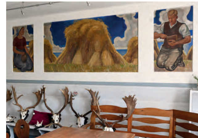
Tierarzt, Postbote und Ernte-Triptychon in der Burgstube, A. Paul Weber 1933