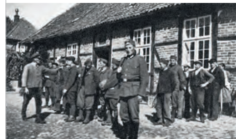
Zweiter Weltkrieg, Kriegsgefangene und Zivilarbeiter auf Siggen

Auf dem Gut Kalkhorst waren ab dem Herbst 1941 russische Kriegsgefangene eingesetzt. Auf Siggen waren nach einer Liste von 1946 rund 25