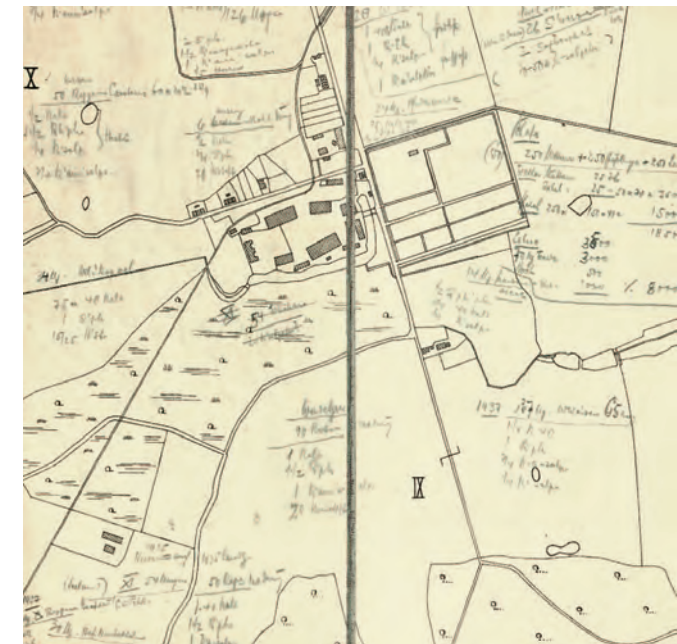
Karte von Siggen mit Eintragungen von Alfred Toepfer zur Nutzung einzelner Flächen, vermutlich 1937