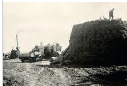
Feldarbeit auf Siggen in den 1930er Jahren