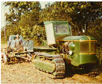
Motorisierung der Feldarbeit, 1960er Jahre