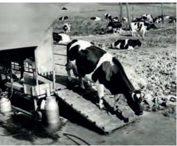
Viehwirtschaft auf Siggen, 1950er Jahre

Nach der Freigabe des Stiftungsvermögens und der Währungsreform 1948 wurden neue Investitionen auf dem Gut möglich. Noch 1948 entstand ein neuer Rinderstall, 1951 wurde eine neue Melkanlage eingebaut, die Schafherde im selben Jahr verkauft. Die Zahl der Arbeitskräfte sank von 55 in 1939 auf 35 im Jahr 1964, die Zahl der Ackerpferde von 32 in 1939 auf fünf in 1965. Ersetzt wurde menschliche und tierische Kraftleistung durch Fahrzeuge und Maschinen. Trecker und Mähfahrzeuge wurden mehr, größer und leistungsstärker. Während sich die Nutzfläche des Gutes nur unwesentlich veränderte, stiegen die Anbauerträge, abgesehen von witterungsbedingt schlechten Jahren stetig an. In Siggen lagen die Erträge weit über dem Durchschnitt der Betriebe in Schleswig-Holstein. Auch die Zahl der Rinder und Schweine auf Siggen stieg weiter an, denn die europäische Subventionspolitik mit garantierten Erzeugerpreisen für Milch, Getreide und Fleisch sorgte für die Möglichkeit eines weitgehend risikofreien Ausbaus der Viehwirtschaft.