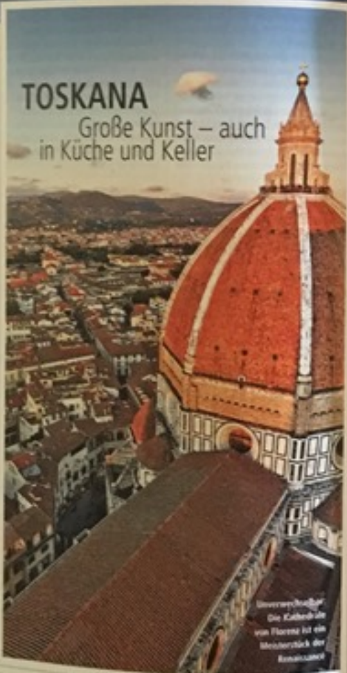
Unvergleichlich Die Kathedrale von Florenz ist ein Meisterstück der Renaissance