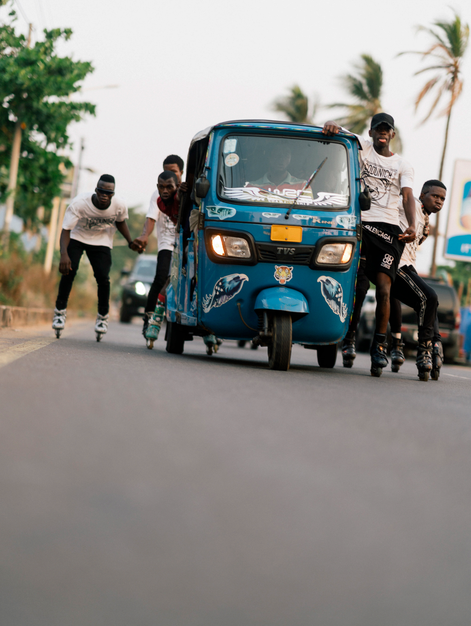
Street Scene Lumley Beach Road