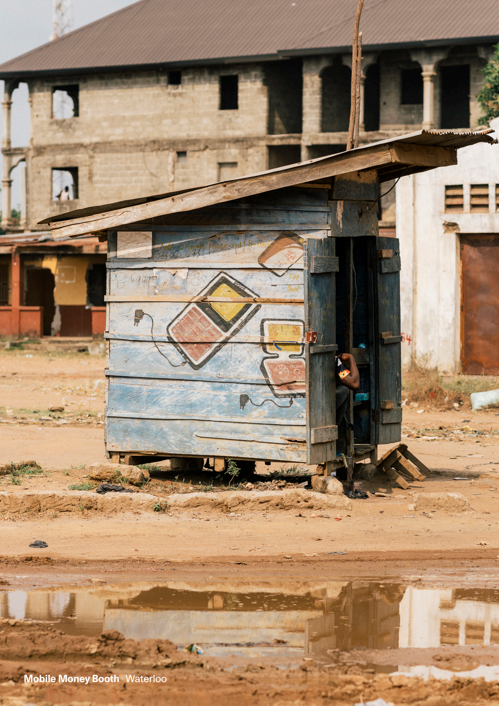
Mobile Money Booth Waterloo