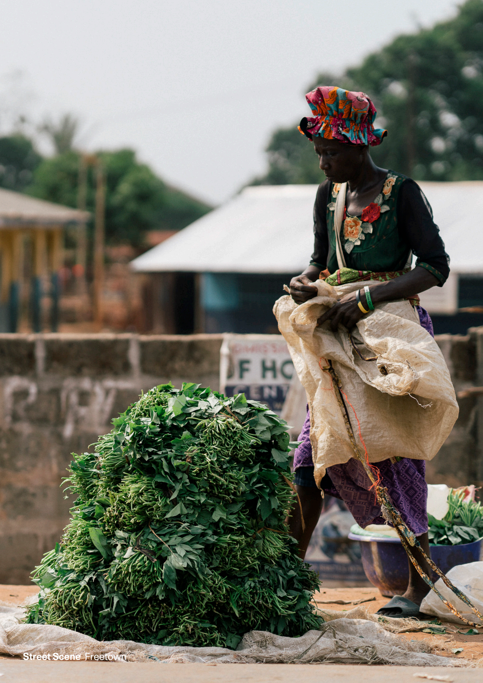
Street Scene Freetown