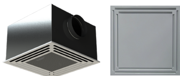
KCD-Q-S/R-PF (Soufflage + Reprise) KCD-Q (Soufflage seul)