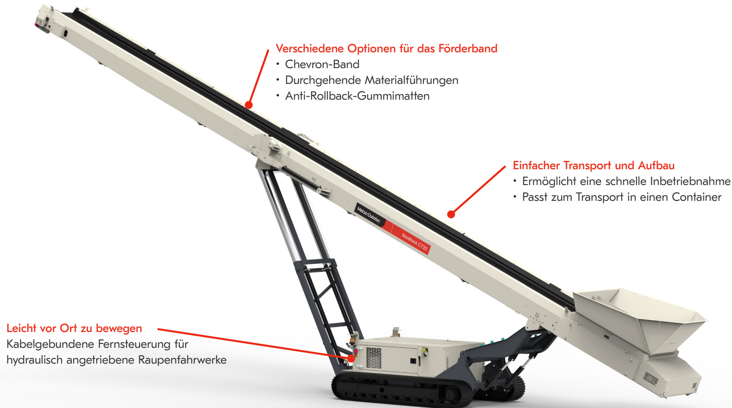
Abb.: Nordtrack™ CT20 Nicht in Nordamerika erhältlich

Die mobilen Haldenförderbänder Nordtrack™ CT20 und CT24 sind eine kostengünstige Alternative zu Radladern. Durch diese Förderbänder entfallen zusätzliche Materialbewegungen mit Radladern. Das verringert Ihre Betriebskosten und verbessert die Qualität Ihres Endprodukts.